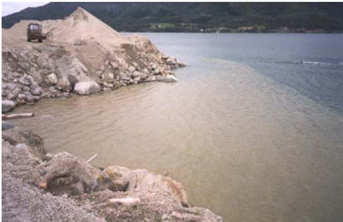
Figur 3. Utslippsområdet for overflødig masse fra sanduttaket til Nordland Betong A/S. Utslippsrøret kan ses i overflaten til venstre på bildet.