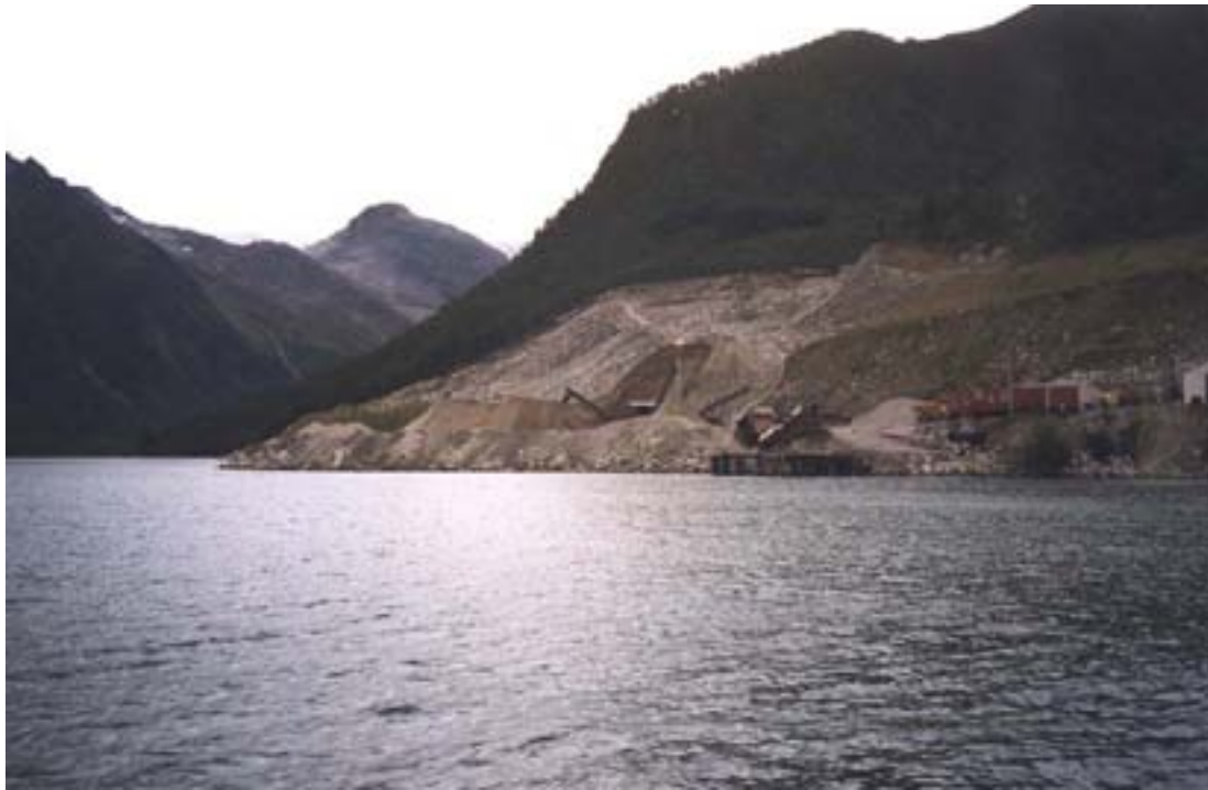
Figur 2. Sanduttaket til Nordland Betong A/S sett fra nordvest.