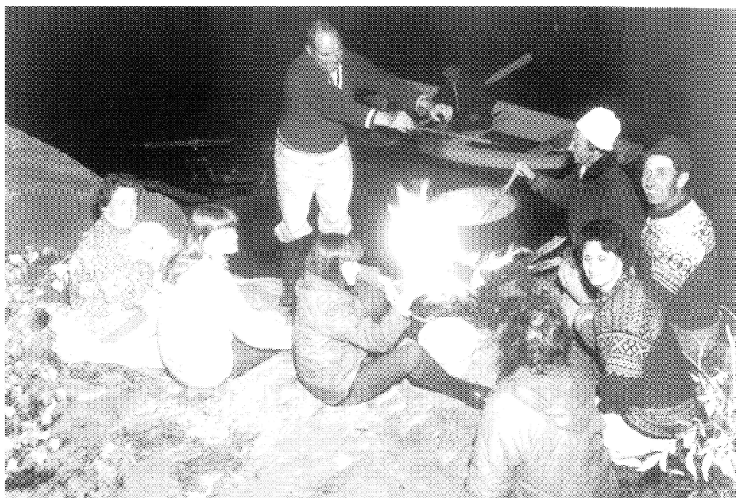
Figur 3 Krepselag ved vannkanten

Det var jo mørkt når man krepset og ikke så lett å se, derfor var det nødvendig med en lyskilde. Enten en lykt, et bål på land som både kunne lyse opp i høstmørket og gi fra seg varme, eller begge deler. Noen kokte kveldens krepsefangst i ei gryte ved elvekanten og satt rundt bålet og spiste den. Dette ble av informantene sett på som den mest opprinnelige og