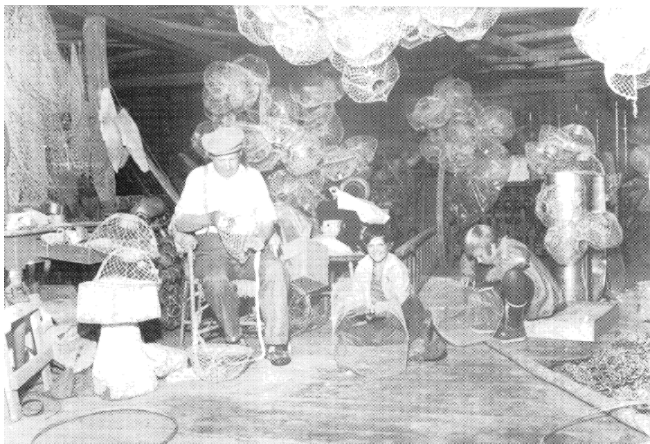
Figur 2 Klargjøring av fangstredskap