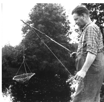
Figur 1 Krepsering med flathåv

Vekja er et uttrykk for å holde øye med, se etter og sjekke. Håvene lå ikke særlig tett. Hadde man mange håver og stort krepseiland tok det litt tid å følge med. For å få tak i krepseren var det vanlig å bruke en kløftet kjepp til å løfte fløret, samtidig som flathåven ble dratt på land. Dette måtte skje raskt for ikke å skremme vekk krepseren. Flathåvene måtte sjekkes ca hvert femtende til tjuende minutt, derfor blir dette betegnet som aktiv krepsering. Kupa beholdt fasongen og trengte ikke samme tilsyn. Hadde krepseren først kommet seg ned i kupa var det umulig å komme opp, derfor kunne kupene ligge natten over.