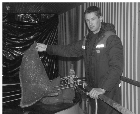
Figur 1 og 2: Hva slags yngelanlegg skal en satse på? Intensive anlegg på land eller mer halvintensive i notposer i sjøen? Forskerne prøver nå ut ulike løsninger i samarbeid med skjellnæringen i inn- og utland.