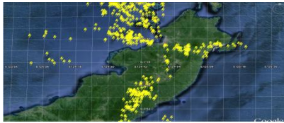
Gambar 5. Flashes tanggal 12 April 2011