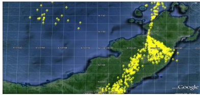
Gambar 4. Flashes tanggal 5 April 2011