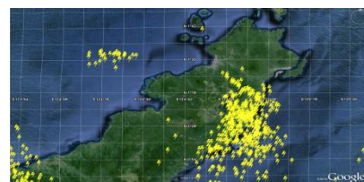
Gambar 3. Flashes tanggal 18 Februari 2011.

Gambar 3 sampai 7 memperlihatkan keadaan strokes dan flashes di sekitar daerah Tondano tanggal 18 Februari, 5 April, 12 April, 17 September dan 29 September yang terdeteksi di Stasiun Geofisika Manado.