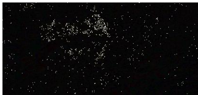
Gambar 6. Flashes tanggal 17 September 2011