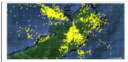
Gambar 7. Flashes tanggal 29 September 2011

Aktivitas kelistrikan yang teramati pada data synop M.E.48 di Tondano tanggal 18 Februari, 5 April, 12 April, 17 September dan 29 September 2011 terdiri dari: guntur, kilat dan awan bermuatan listrik (awan Cb) tertera pada Tabel 7. Data synop M.E.48 adalah data pengamatan unsur-unsur cuaca yang diamati tiap jam. Unsur-unsur cuaca tersebut adalah jarak pandang, hujan, angin, udara, penyinaran matahari, penguapan air, perawanan, kilat dan guntur yang ditulis dengan format synop yang dikirim tiap 3 jam ke Organisasi Meteorologi Dunia (BMKG, 2011).