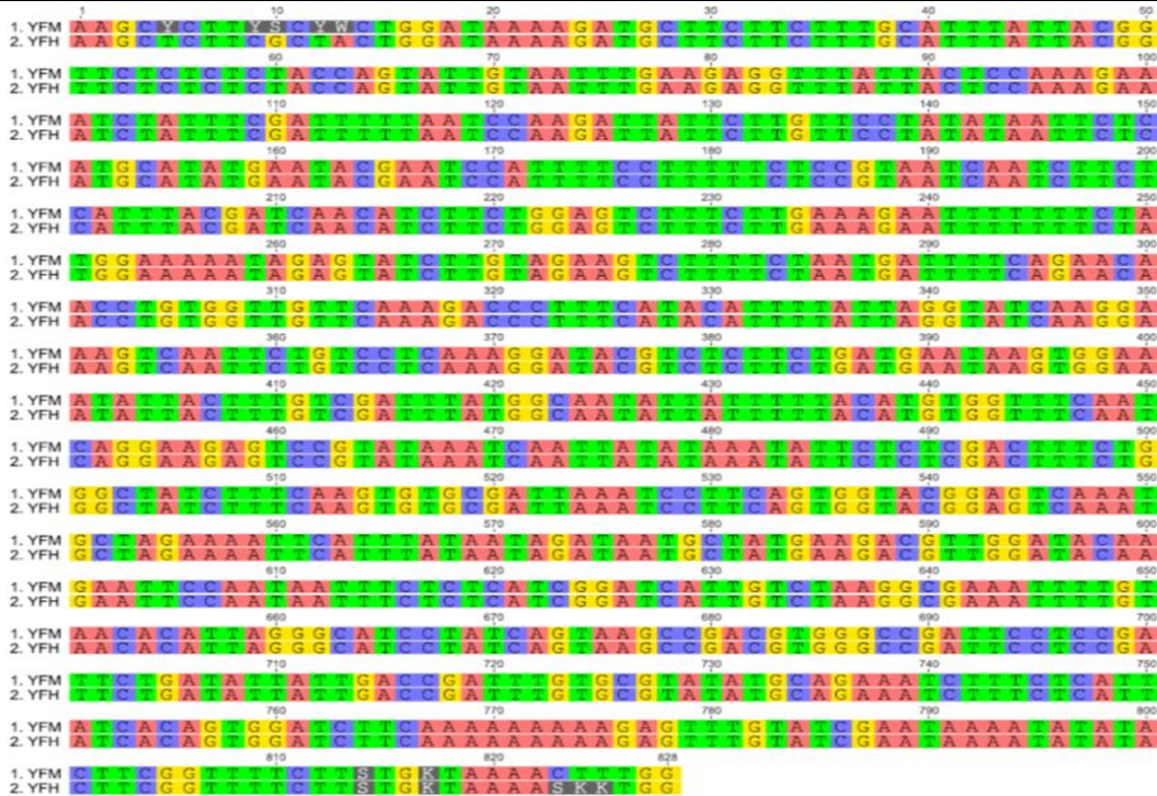
Gambar 2. Perbandingan sekuens DNA bercode dari tumbuhan gedi merah (YFM) dan gedi hijau dengan (YFH).