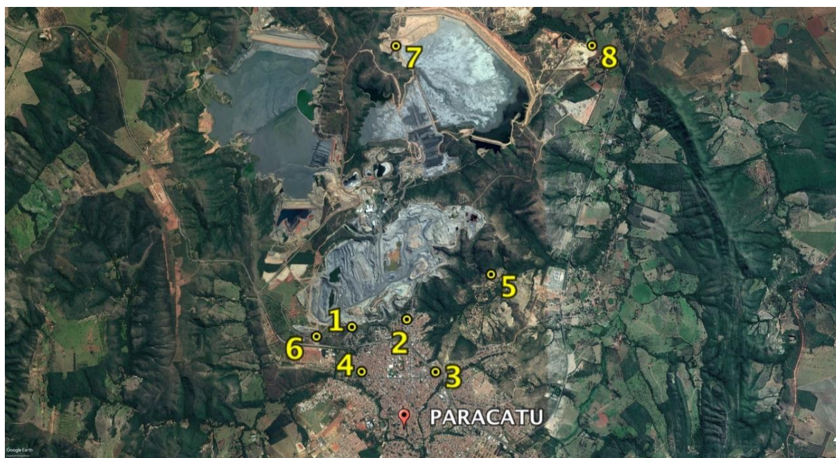
Figura 1. Imagem com a localização geográfica dos amostradores de material particulado atmosférico existentes no município de Paracatu.