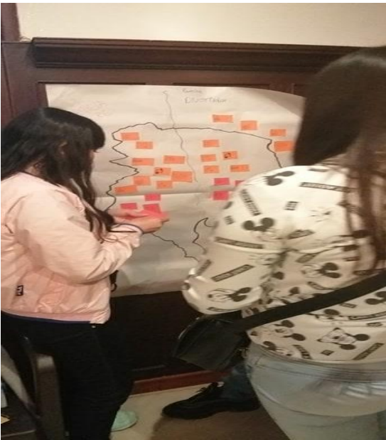
Taller 2, agosto de 2019, elaboración propia

del colegio le fuera mal y en el último se pusiera las pilas, en los centros comerciales porque todos querían comer en distintos lugares y por esto se peleaban.