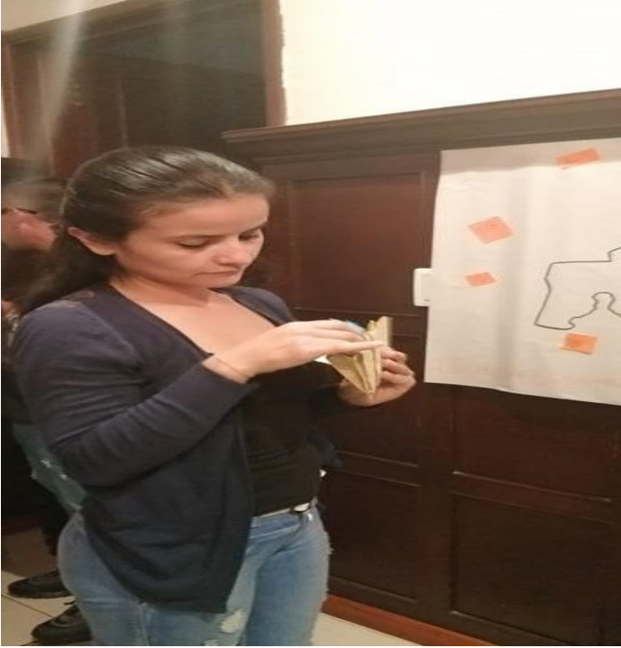
Taller 2, agosto de 2019, elaboración propia

Al finalizar la actividad intervinieron 4 familias explicando que pusieron en su cartografía social, por lo cual la familia 3 para la categoría de tiempo libre expuso que se la pasaban en la casa, dialogaban, veían películas en su casa puesto no tenían dinero para ir a cine, también compartían con una familia que tenía 3 niños y que tenía una relación amena con ella y por ello compartían con sus hijos, también iban a la iglesia, salían a algunos centros comerciales fuera de la localidad y disfrutaba al máximo el día, solían comer mucho, de vez en cuando iban donde la familia lejana, compartían en el parque procurando tener tiempo libre llevándolos a citas médicas.