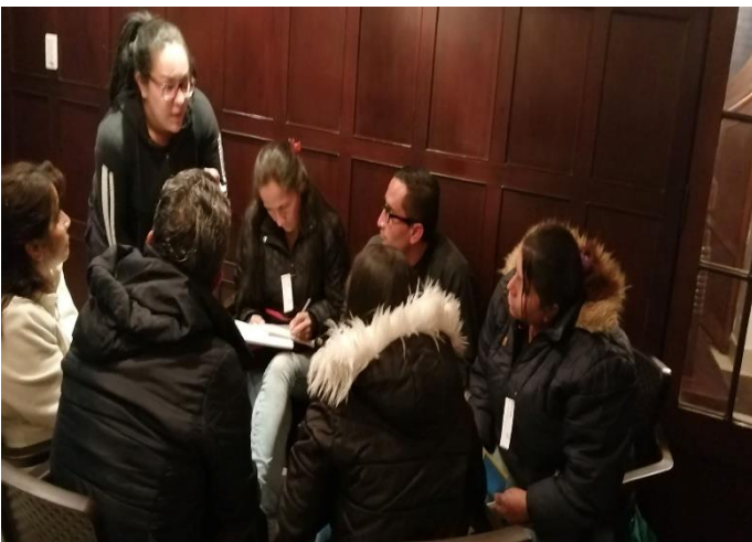
Taller 1, agosto de 2019