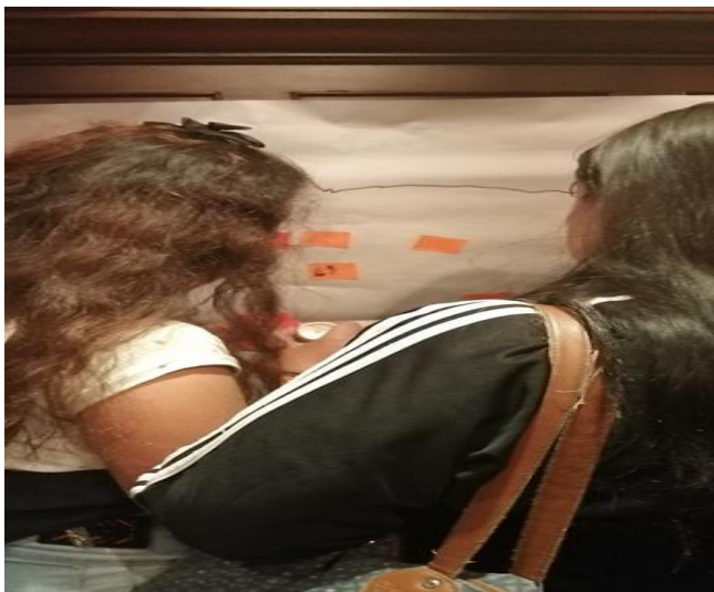
Taller 2. Agosto de 2019, elaboración propia

comunitarias o religiosas y relaciones laborales o de estudio y por ultimo las redes institucionales que son las “organizaciones gestadas o constituidas” que tiene un propósito u objetivo en específico, el cual es satisfacer necesidades en el sistema de los individuos redes institucionales básicas por ejemplo son: la escuela, el sistema de salud y el sistema judicial.