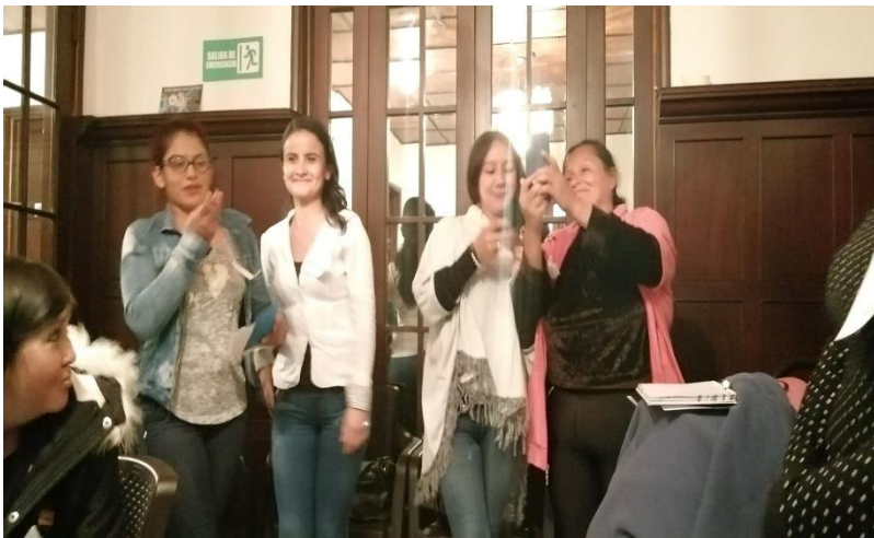
Taller 1, agosto de 2019, elaboración propia

Para finalizar se realizó una actividad de reflexión que consistió en colocar la canción sorprenderte de Fonseca y que cerraran sus ojos y recordaran los momentos buenos que han pasado a lado de su familia, donde la familia 3 lloro reconociendo que el proceso ha sido difícil pero que es importante que su hijo cambie “su actitud y su grosería”. Después, facilitamos una hoja a todos con la letra de la canción y se deja dos tareas traer el genograma realizado por ellos en el módulo 1 y escoger una frase que les haya llamado la atención de la canción y para la otra sesión explicar el porqué de la frase, igualmente la invitación a que sigan asistiendo a las sesiones.