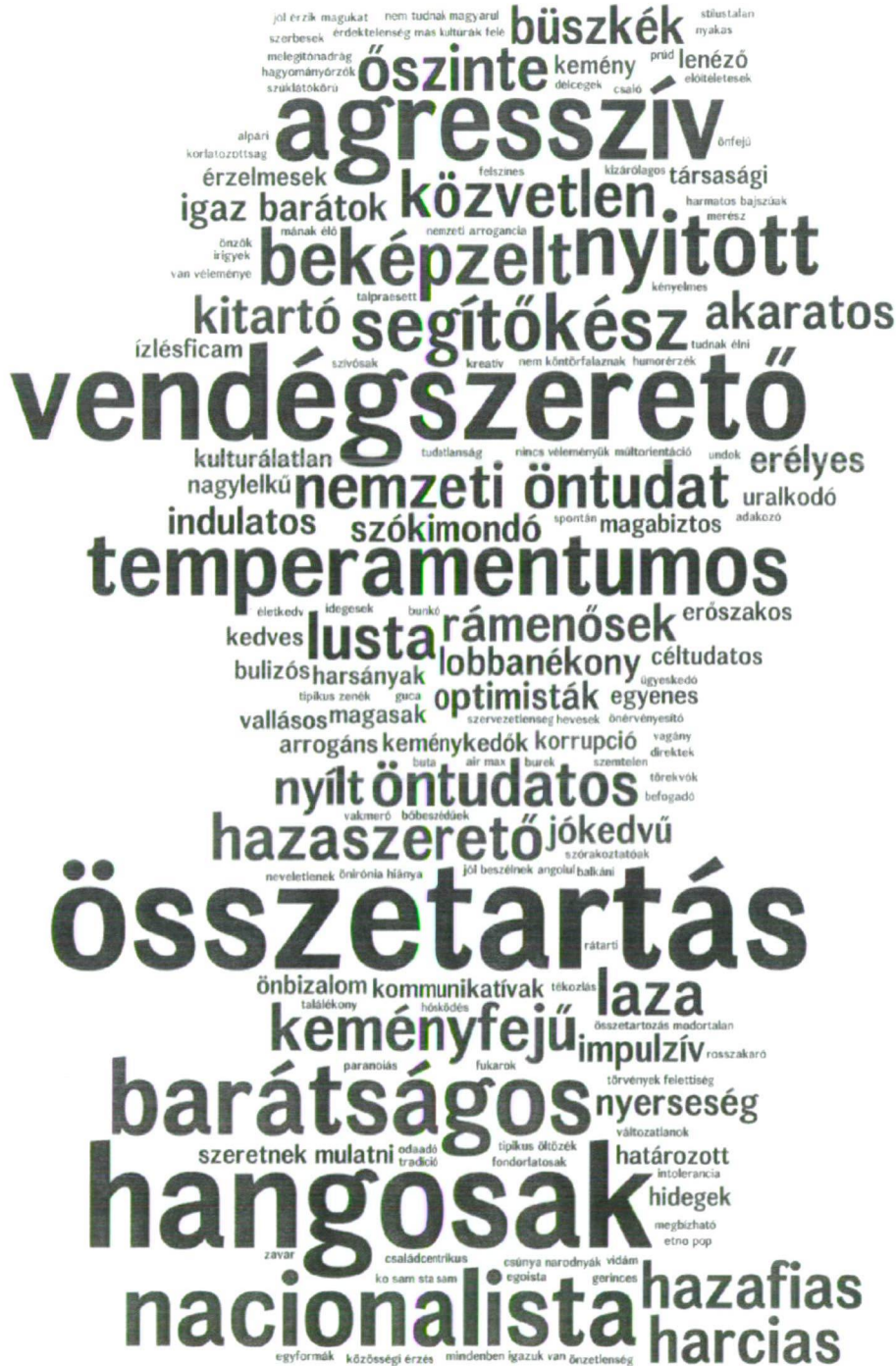
3. ábra: Vajdasági magyarok a szerbekről (432 említés alapján)