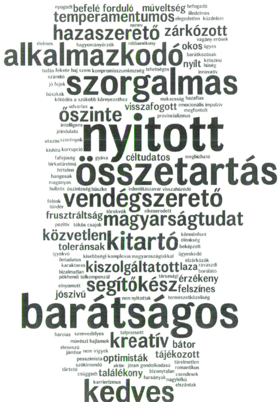
1. ábra Magyarországiak a vajdasági magyarokról (231 említés alapján)