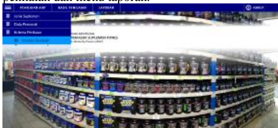
Gambar 3. Menu Pada Halaman Admin

Gambar 2 merupakan tampilan dari halaman. Setelah login dan berhasil, maka admin akan diarahkan menuju halaman utama admin. Dalam menu utama terdiri dari berbagai menu, yaitu menu pilih jenis pekerjaan, data pelamar, kriteria penilaian, matriks penilaian, penilaian pelamar, hasil penilaian dan menu laporan.