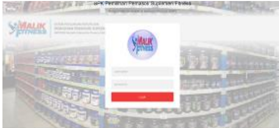
Gambar 2. Halaman Login Admin

Berdasarkan hasil analisis dan perancangan sistem yang telah dilakukan, maka dilakukan implementasi sistem penerapan metode analytic hierarchy process dalam pemilihan pemasok suplemen fitnes dengan menggunakan bahasa pemrograman PHP.