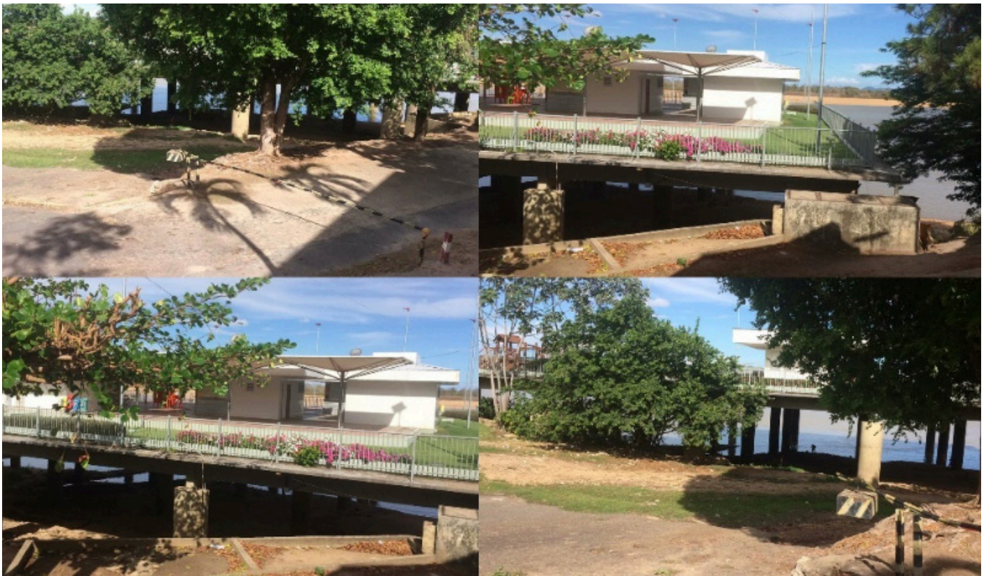
Figura 11 - Diferentes perspectivas da Orla Taumanan como barreira física para contemplação da paisagem.