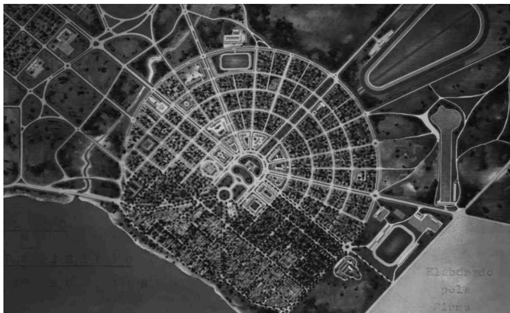
Figura 6 - Maquete do Plano Urbanístico - 1946.

(FREITAS, 1993). O contrato do serviço foi assinado no mesmo ano, e a partir de então, foram realizados o desenvolvimento do projeto, coleta de dados in loco como o levantamento topográfico, estudos relacionados ao rio, às construções existentes e conhecimento do modo de vida da população.