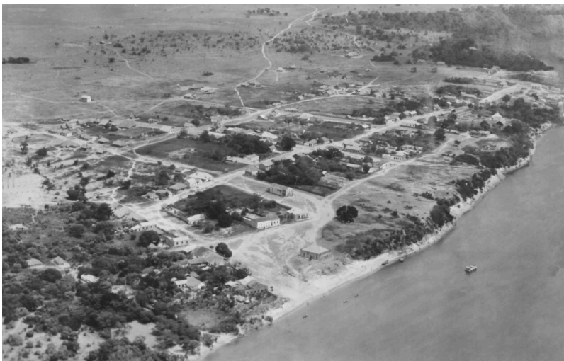
Figura 2 - Porto do Cimento.