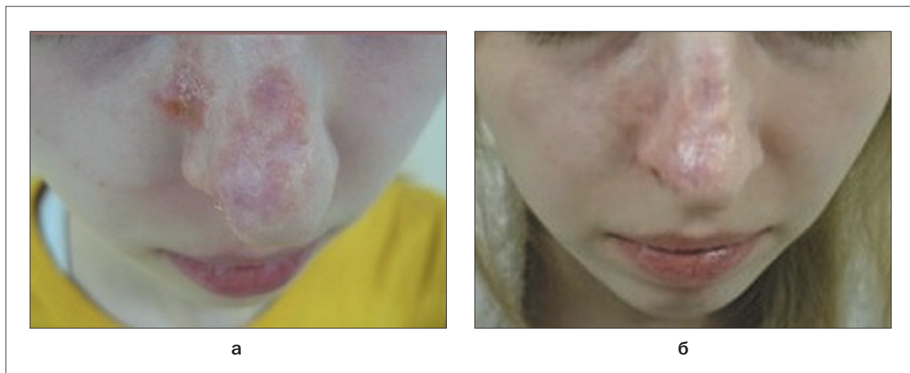
Рис. 2. Клиническая картина: а – до проведения ФДТ (апрель 2010 г.); б – после проведения ФДТ (июль 2010 г.)

В сентябре 2013 г. проведен 1 курс ФДТ (фотолон) на 6 очагов рецидивного базальноклеточного рака кожи по краю зоны ФДТ: в области правого ската носа ближе к крылу носа (опухолевый очаг темно-розово-