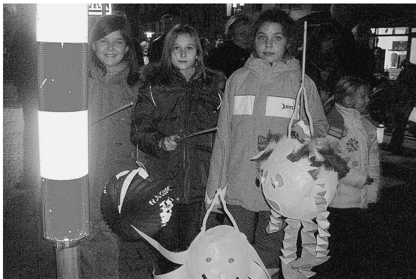
図5-5 手作りランタンをもつマルチン祭の子ども