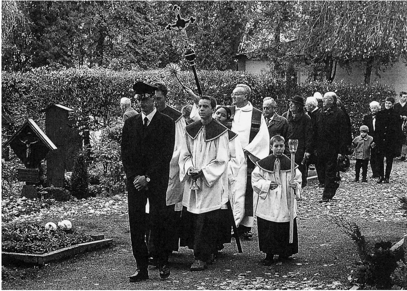
図 5-4 諸精霊の日 (Fischer, Anke: Feste und Bräuche in Deutschland. )