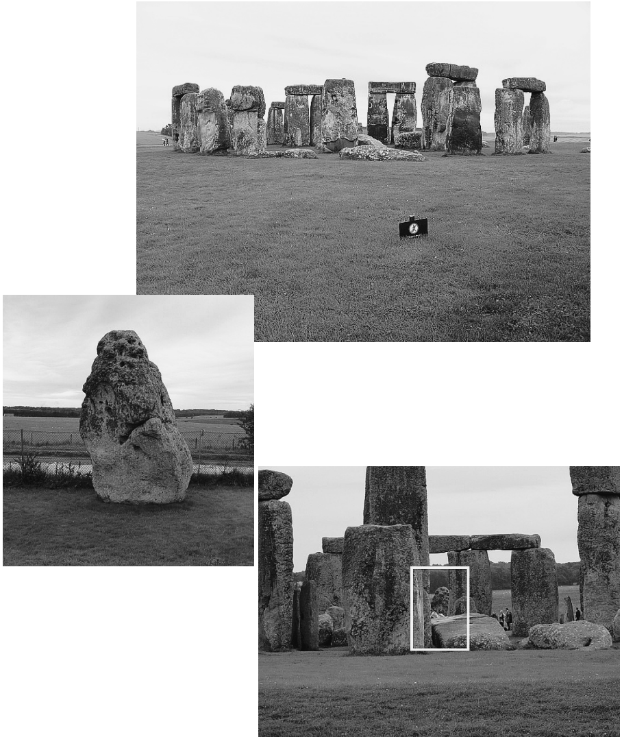
図5-1 イギリス南部のストーンヘンジとその外縁にあるヒールストーン ストーンヘンジの真ん中に立ってヒールストーン（中段左側の立石）を見ると、 太陽はそのままストーンヘンジの中央部を照らすので、6月21日の夏至にそこ から太陽の昇るのが観察される。同様に、冬至の正確な時期もわかるように立 石が置かれていた。