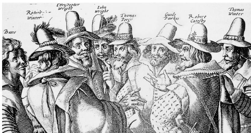
図5-6 ガイ・フォークス、右から3人目

イングランド国教会の王党派は、事件が発覚した一月五日の前の晩に、「ガイ・フォークス・デイ」という祭りを設定した。この事件を忘れないように記憶に刻み付けるためである。当日、ガイ・フォークス一味の巨大な人形が広場にかざられ、そのなか に花火が仕込まれた。祭りの最後にこれに火をつけ、花火大会も