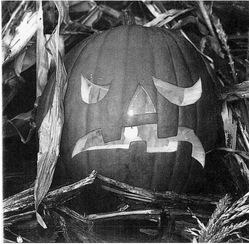
図5-3 かぼちゃのランタン

(Fischer, Anke: Feste und Bräuche in Deutschland. )