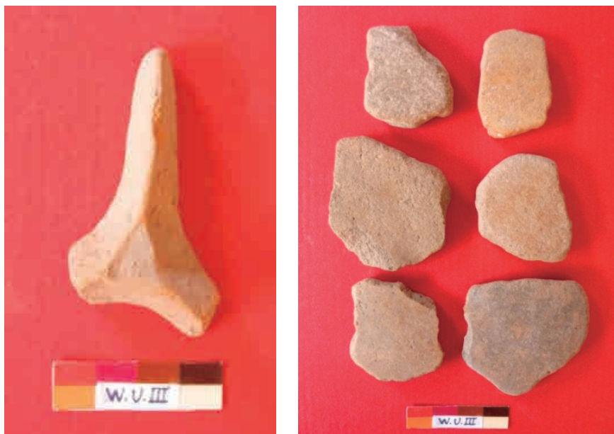
Figura 18: Alisadores de cerámica (a y b) período Formativo