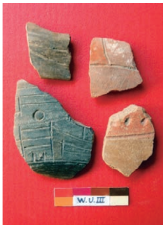
Fig. 10: Cerámica de estilo Rancho.