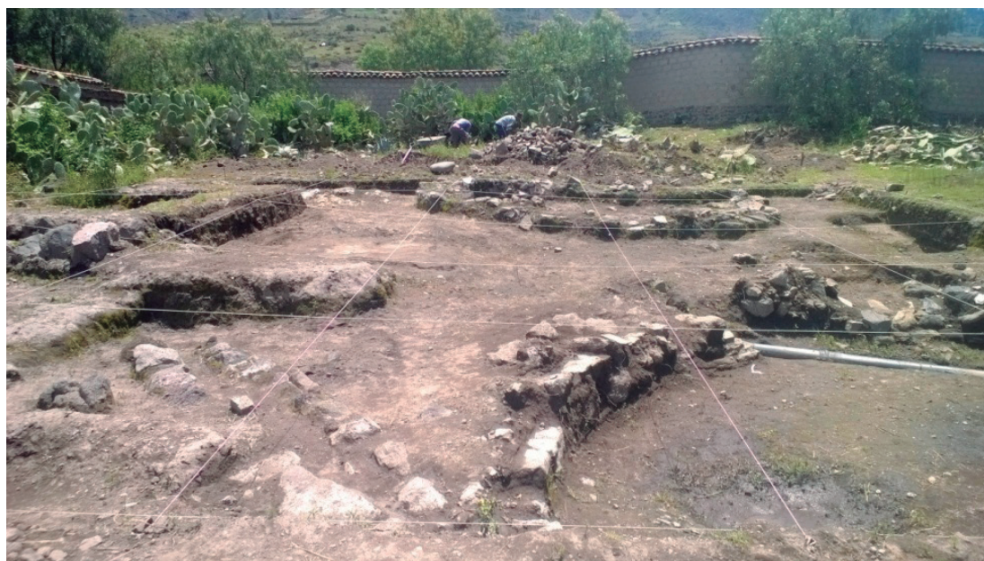
Figura 2: Arquitectura definida donde se observa la instalación de una Tubería de agua que dejó expuesto perfiles con estratigrafía que sirvió de referencia para la excavación en área

El hallazgo 1, Olla de base cónica de 34 cm de alto, 31 de ancho en la parte más ensancha del cuerpo de forma globular, cuello corto con labio ligeramente expandido al exterior de 16 cm de diámetro en la boca, parte del cuerpo se encuentra ennegrecido con hollín producto de la actividad doméstica, estaba enterrada en el ángulo del recinto en “D”, cubierto por fragmentos gruesos de otra vasija que llegaban hasta el nivel del piso formando un contexto específico. En el interior había tierra suelta hasta la mitad inferior de la vasija el resto vacío, es probable que haya contenido líquido el cual se fue evaporando con el tiempo. El hallazgo 2, corresponde a un cuenco de 4 cm de alto por 7.5 cm de diámetro, fue encontrado boca abajo sobre el piso cerca del muro recto en medio ceniza y otros fragmentos de tipo Qarqampata, y el hallazgo 3, corresponde a un cuenco de 8 cm de alto por 19 cm de diámetro en la boca, presenta decoración pintado de color rojo en franjas cruzadas en forma de asterisco en el interior del cuenco, asentado sobre el piso, junto a pulidores de canto rodado en medio de ceniza, tal como se deja los objetos después de comer en una vivienda doméstica.