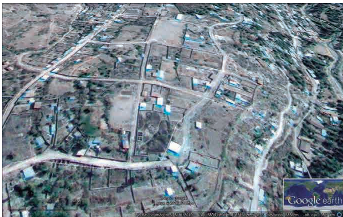
Figura: Ubicación del sitio en fotografía satelital.

Machaca (1987) realiza excavaciones en la ladera suroeste de Ñawimpuquio, informa de la definición de un recinto en “D” de la época Huarpa reutilizada en la época Wari con la explotación de canteras y talleres artesanales de elaboración de cuentas de moluscos. Cabrera (1998 b), en el contex-