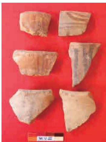
Figura 14: Cerámica de estilo Huarpa