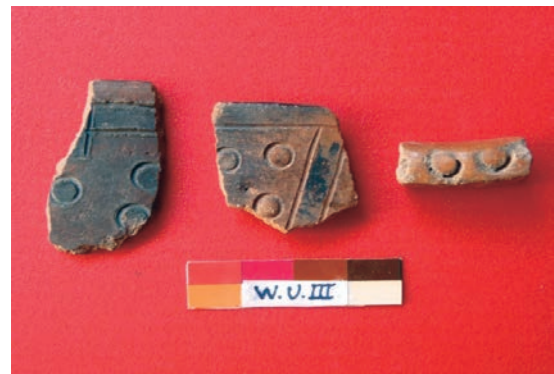
Figura 9: Cerámica de estilo Kichkapata.