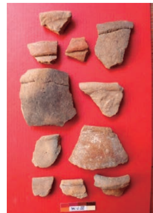
Fig. 12: Cerámica de estilo Tunasniyoq.