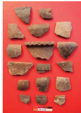
Figura 7: Cerámica de estilo Wichqana.