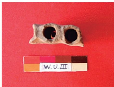
Figura 17: Fragmento de antara de estilo Wichqana