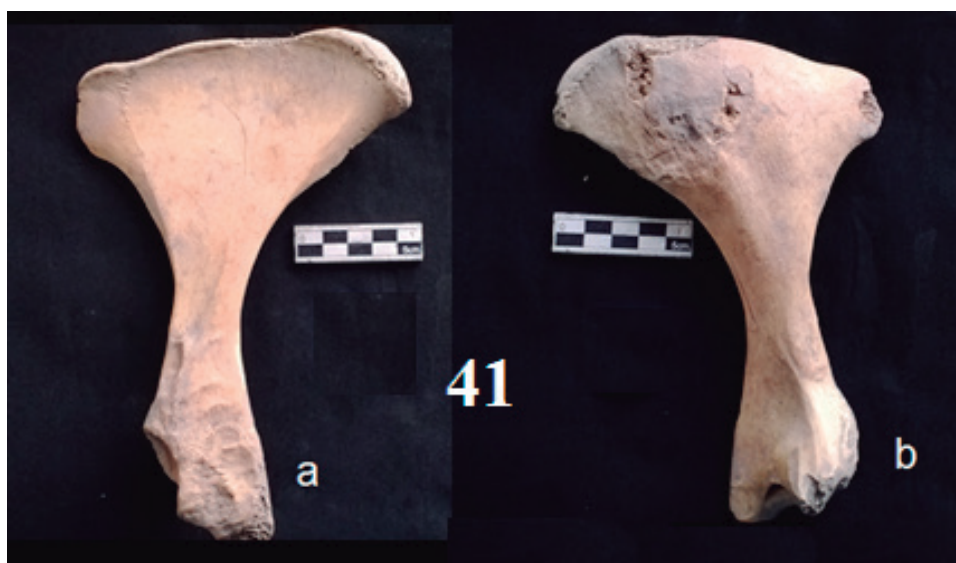
Figura 21: Cara externa (a) e interna (b) de una de las pelvis de alpaca, con desgaste en el borde iliaca (alisador), considerado como la "illa". Unidad III, cuadrícula G3, Capa E. Relleno bajo el piso quemado (EA2), sobre suelo estéril.