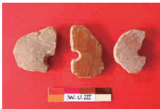
Figura 16: Piruros hechos en fragmentos de cerámica del periodo formativo