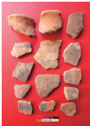
Fig. 11: Cerámica de estilo Chupas.