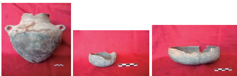
Figura 4: Hallazgo 1 Hallazgo 2 Hallazgo 3