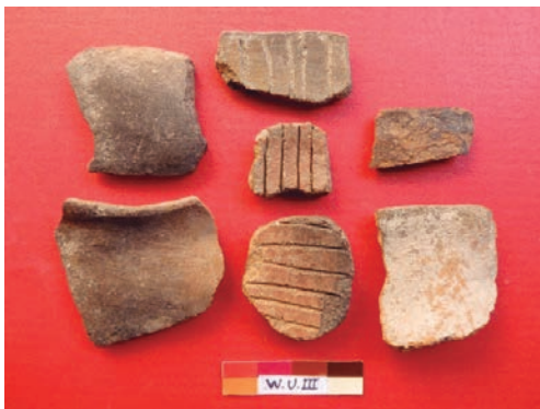
Figura 8: Cerámica de estilo Qarqampata.