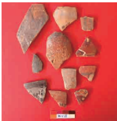
Figura 15: Cerámica de diferentes estilos Wari