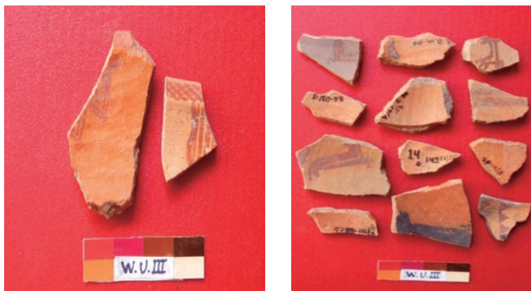
Figura 13. Cerámica de estilo Caja Huamanga