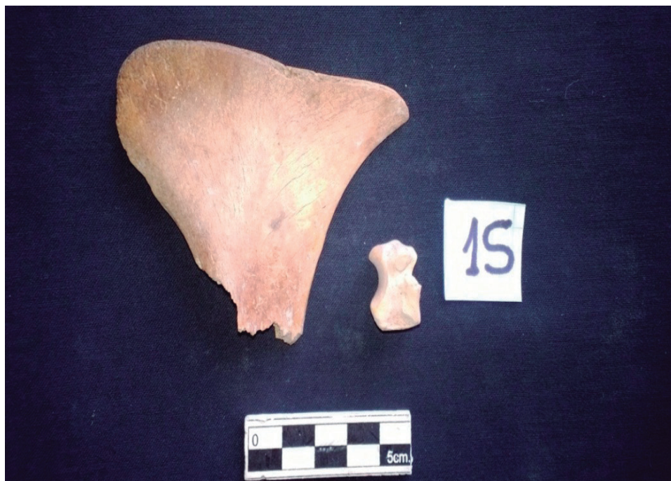
Figura 20: Pelvis de camélido adulto, con desgaste en el borde. Unidad III, cuadrícula C3, capa B.