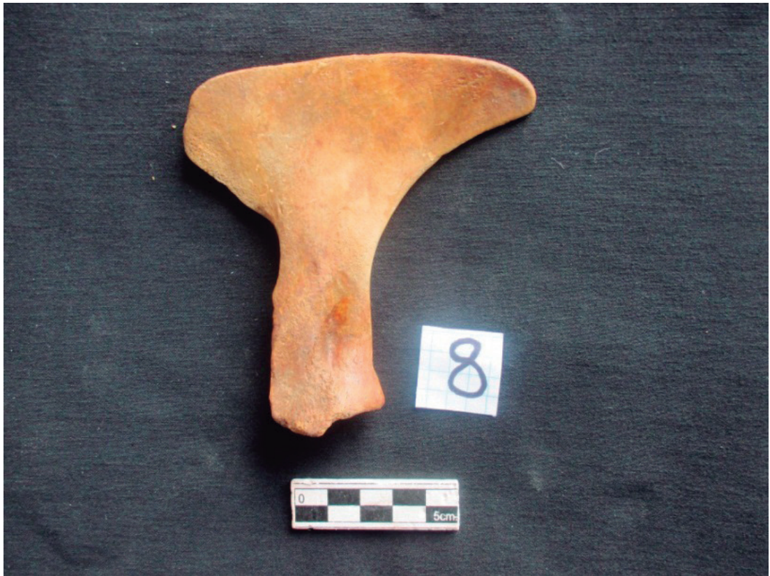
Figura 19: Pelvis izquierda de camélido, trabajada y desgastada en el borde iliacaal “alisador”, considerado como una “illa”. Unidad III, cuadrícula E1, capa B.