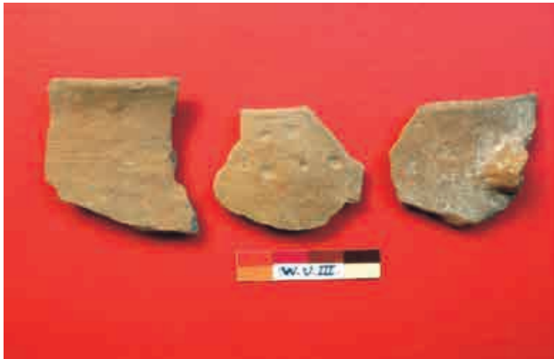
Figura 6: Fragmentos de cerámica de estilo Andamarca.