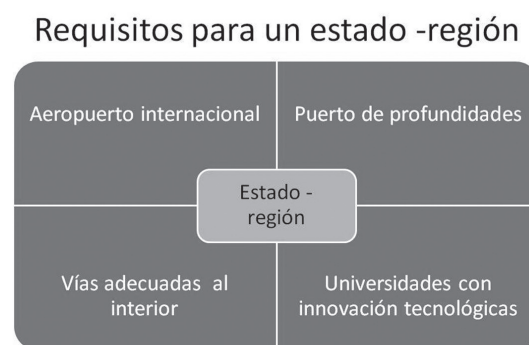
Gráfico N° 1

Ohmae considera que los Estados – nación caerán en una serie de crisis, como los de Europa y los de África, tanto políticas como económicas, y serán reemplazados por los estados - región, como son los casos de Singapur (que es una ciudad estado, en realidad), Irlanda, Finlandia, Delian y muchos otros en China. En Sudamérica, sólo menciona a Sao Paulo, Brasil, pero podemos vislumbrar que algunas regiones peruanas de la costa, como Lima – Callao o La Libertad, potencialmente podrían considerarse como candidatas a “estados región” según este modelo.