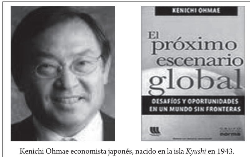
Kenichi Ohmae economista japonés, nacido en la isla Kyushi en 1943.

Cabe notar que el análisis del libro, de 2005, no alcanza los hechos de la crisis financiera internacional de septiembre de 2008 y sus repercusiones, lo que nos permitirá comparar mejor en el tiempo las formulaciones.