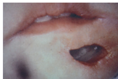
Fig. 2. Extensión de la necrosis con perforación de la piel de la cara. De Mario Jiménez tomado del libro Atlas de Enfermedades Orales en niños, adolescentes y adultos jóvenes.

Las Enfermedades periodontales necrotizantes (EPN) evolucionan rápidamente, destruyen los tejidos gingivales, y se extiende por el tejido conjuntivo hasta el tejido óseo, e incluso la mucosa bucal y en algunos casos llegar a perforar y destruir las áreas faciales (Fig. 2 y Fig. 3).