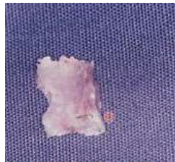
Secuestro óseo del paciente de la Fig. 6.