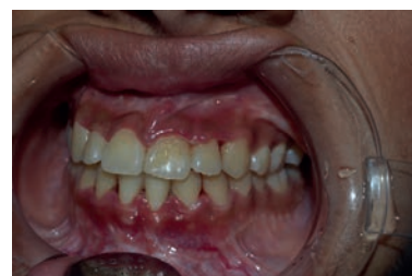
Fig. 20. Alteraciones gingivales típicas de la GUNA.

Otra opción es recomendar el uso de antibióticos sistémicos, pudiendo elegirse penicilina, tetraciclina y metronidazol de acuerdo al criterio del profesional. 24,25,26