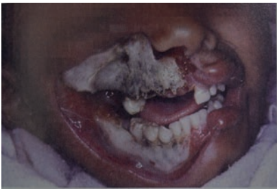
Fig. 3. Estado de Noma terminal, extensión a las estructuras faciales en un niño. De Mario Jiménez tomado del libro Atlas de Enfermedades Orales en niños, adolescentes y adultos jóvenes.

Con el criterio de tener una idea más clara para una clasificación de los estadios y como puede evolucionar desde un GN hasta un NOMA (Fig. 3) esta puede incluir los siguientes estadios, según Horning y Cohen : 18