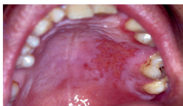
Fig.19. Diagnóstico diferencial con la gingivostomatitis herpética aguda. Las vesículas herpéticas después de romperse se unen y forman un área rojiza muy irregular

Debemos mencionar algunas entidades patológicas que pueden ser de utilidad para el diagnóstico diferencial. Estas son: gingivostomatitis herpética (Fig.19).