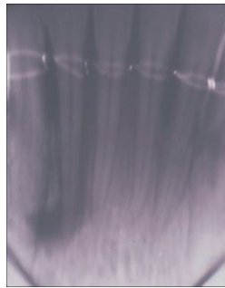
La radiografía del paciente de la Fig. 6. muestra la destrucción del tejido óseo.