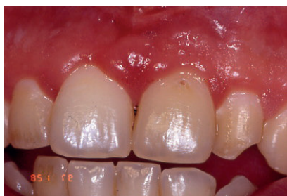
Fig. 18. Evolución después del tratamiento periodontal del paciente a los dos meses. Obsérvese la restitución de la anatomía periodontal, lo que va a facilitar una buena higiene periodontal.