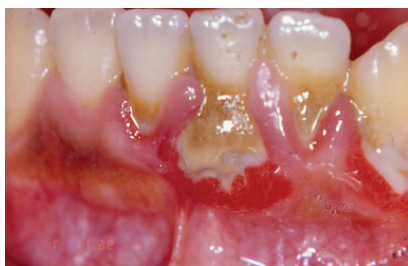
Fig 15 Diagnóstico diferencial con acumulación abundante de tártaro y desplazamiento de la encía marginal. Los tejidos gingival están inflamados