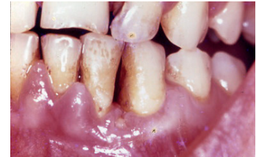
Fig. 11. Paciente con pérdida de los tejidos gingivales y con destrucción ósea: periodontitis necrotizante (PN).