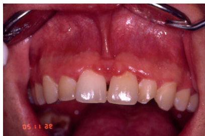
Fig. 16. Cirugía en el paciente para corregir las alteraciones gingivales mediante gingivoplastia.