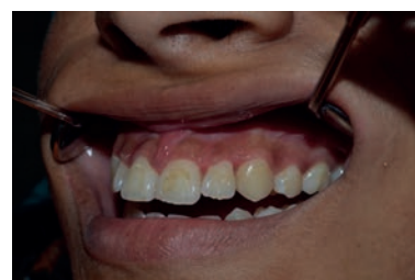
Fig. 21. Dos semanas después del tratamiento inicial, especialmente con higiene periodontal usando técnica de bass modificada.