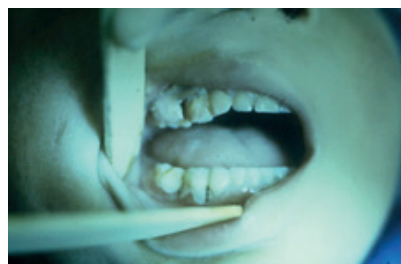
Fig. 1 Niño de cinco años con necrosis de la encía papilar, marginal y tejidos subyacentes.

Los autores muestran un caso (cedido por cortesía de la Dra. Ena Bances Chavarry) en un niño de 5 años de edad donde se aprecia la destrucción del tejido gingival, llegando a exponerse el tejido óseo subyacente (fig.1).