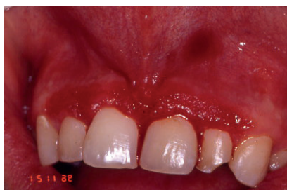
Fig. 17. Cirugía en el paciente de la Fig. 16. para corregir las alteraciones gingivales mediante gingivoplastia.