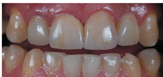
Fig. 4 Estratificación por capas de las piezas restauradas