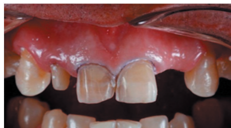
Fig. 2 Preparación de las piezas dentarias