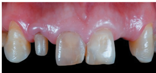
Fig.1 Foto inicial de las piezas a restaurar