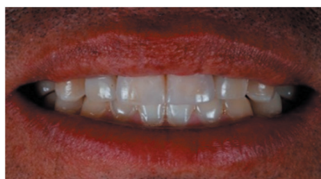
Fig.5 Resultado final del caso

cosa poco manejable debido a la escasez de variedad de tonalidades; las resinas Beautifil II con tecnología Giomer y las de Ceramage nos han demostrado en este caso clínico que la biomimetización lograda es tal que pasa invisible a la vista.