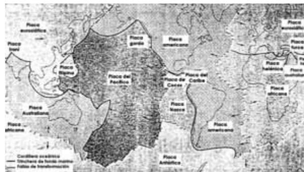
Figura 4: Principales Placas Tectónicas del Globo Terráque. La Litosfera puede separarse en seis grandes placas y en varios fragmentos de placas más pequeños rodeados por márgenes constructivos a lo largo de las dorsales oceánicas, márgenes destructivos marcados por trincheras submarinas y márgenes permanentes indicados por los largos escarpes del piso oceánico. ( Reimpreso de John Dewey, Scientific American, páginas 56-57, mayo de 1972)

Este proceso de tectonismo de la convergencia de las Placas de América y Nazca, la dorsal de Nazca, cambios de rumbo de la Cordillera en el Codo de Arica, en la deflexión de Abancay, en la deflexión de Huancabamba han dado al Perú un País rico en yacimientos de minerales de diferentes tipos. Por ello el Perú fue un País Minero, es un País Minero y será un País Minero. Lo cual se presta a un excelente campo de acción para los jóvenes geólogos a especializarse en el Campo de Yacimientos de Minerales y Geología Minera.