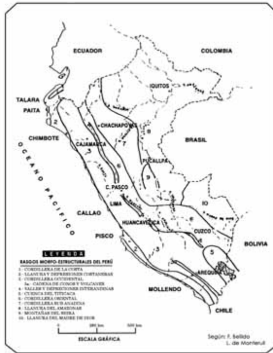
FIGURA N° 1: Mapa Morfológico del Perú

La fase magmática está representada por grandes intrusivos graníticos, granodioríticos y stocks básicos. Algunos de estos intrusivos tienen relación genética con la mineralización de Época Metalogénica del Paleozoico.