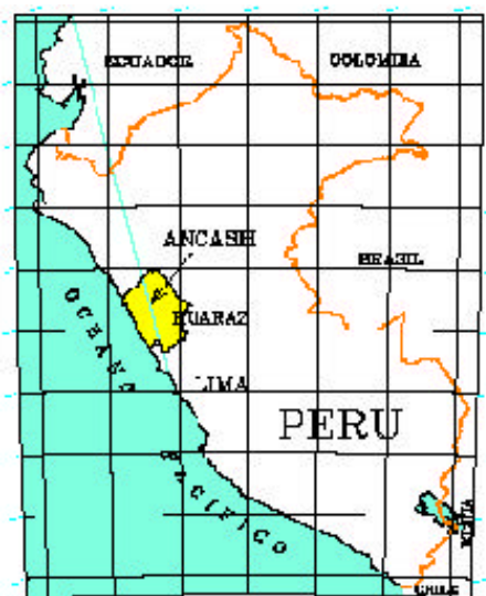
Figura N.º 2. Ubicación geográfica del Puerto de Huarney.

El puerto de Huarney (Figura N.º 2) se encuentra situado a 293 km al norte de Lima, en la provincia de Huarney, departamento de Ancash, a lo largo de la Península Cabeza de Lagarto, al sur de la ciudad de Huarney, inmediatamente contiguo a Puerto Grande, una caleta de pescadores, y a las fábricas de producción de harina de pescado.