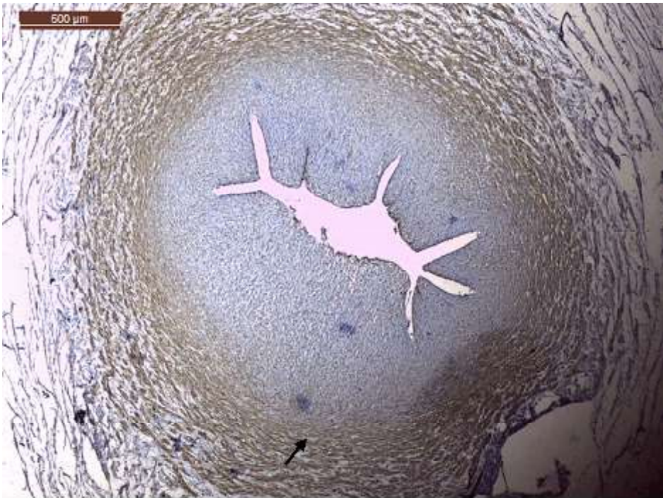
Figura 3. Arteria umbilical de alpaca a los 170 días de gestación. Se señala la intensidad fuerte (+++) de antígenos receptores de angiotensina en las células musculares lisas (IHQ, contraste H&E 4x)