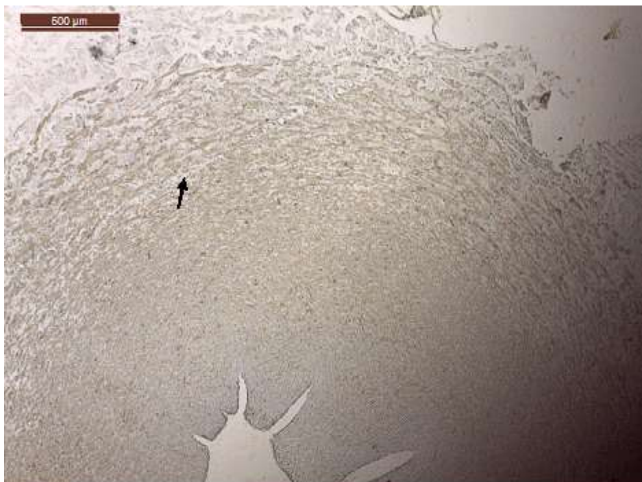
Figura 4. Arteria umbilical de alpaca a los 270 días de gestación. Se señala la intensidad fuerte (+++) de antígenos receptores de angiotensina en las células musculares lisas (IHQ, contraste H&E 4x)