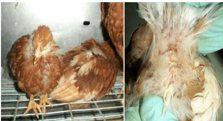
Figura 2. Signos clínicos de la enfermedad de Gumboro en pollas de levante de postura comercial. Izquierda: depresión; Derecha: diarrea