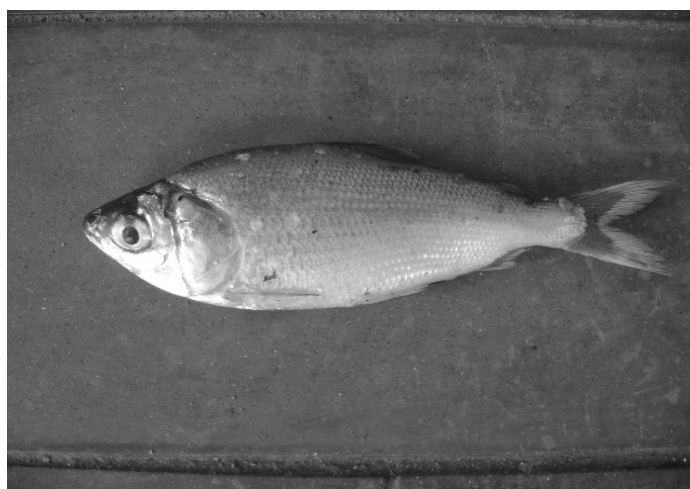
Figura 1. Ejemplar adulto de chiochío ( Psectrogaster rutiloides )

La fecundidad es entendida como el número de oocitos maduros presentes en las hembras en el momento previo al desove. Estudios sobre fecundidad señalan un estimado de 14 589 ovocitos en la Orinoquia de Venezuela para P. ciliata (Rodríguez-Olarte et al. , 2001) y de 37 000 ovocitos por hembra