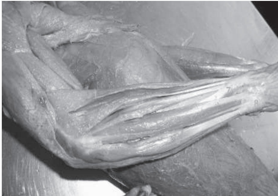
Figura 1. Músculos superficiales de la cara lateral de antebrazo del mono Cebus albifrons . 1: m. braquioradial, 2: m. extensor carpo radial largo, 3: m. extensor carpo radial corto, 4: m. extensor digital común, 5: m. extensor digital lateral, 6: m. extensor carpo cubital, 7: m. abductor largo del pulgar, 8: ligamento transverso dorsal del carpo