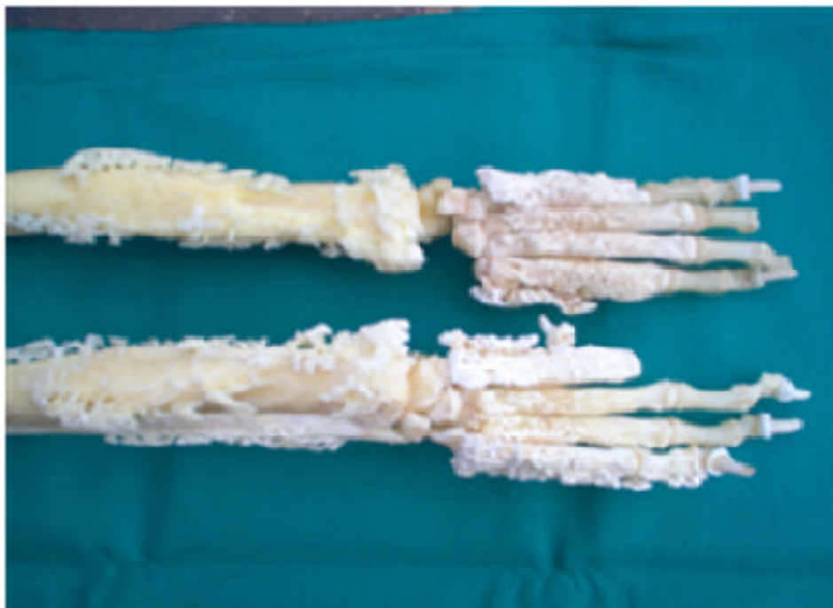
Figura 2. Extremidades de un Bóxer evidenciando neoformaciones óseas periostales sin compromiso articular