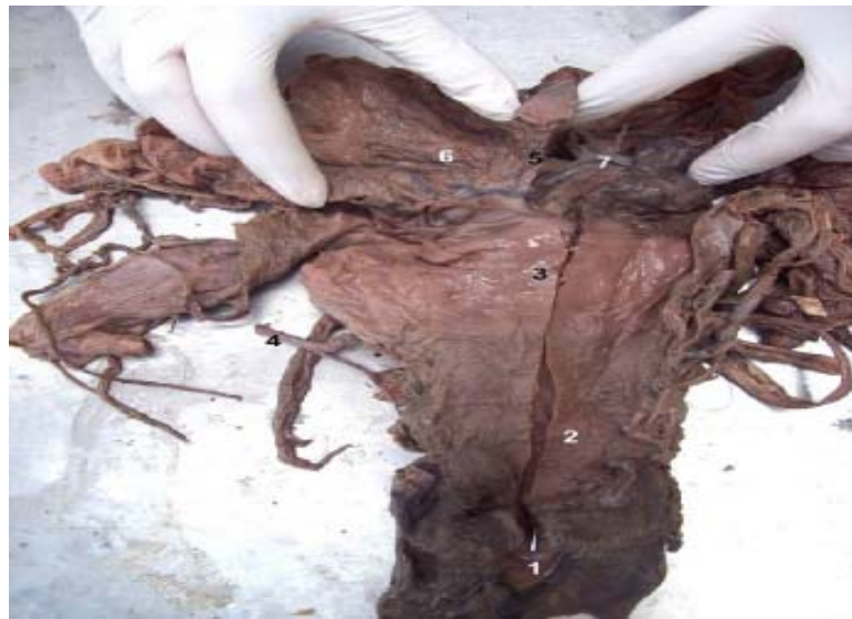
Figura 1. Vista dorso caudal del aparato reproductor femenino de la llama. 1. Vestíbulo vaginal; 2. Vagina; 3. Cérvix; 4. Arteria uterina derecha; 5. Velo uterino; 6. Cuerno uterino derecho; 7. Cuerno uterino izquierdo