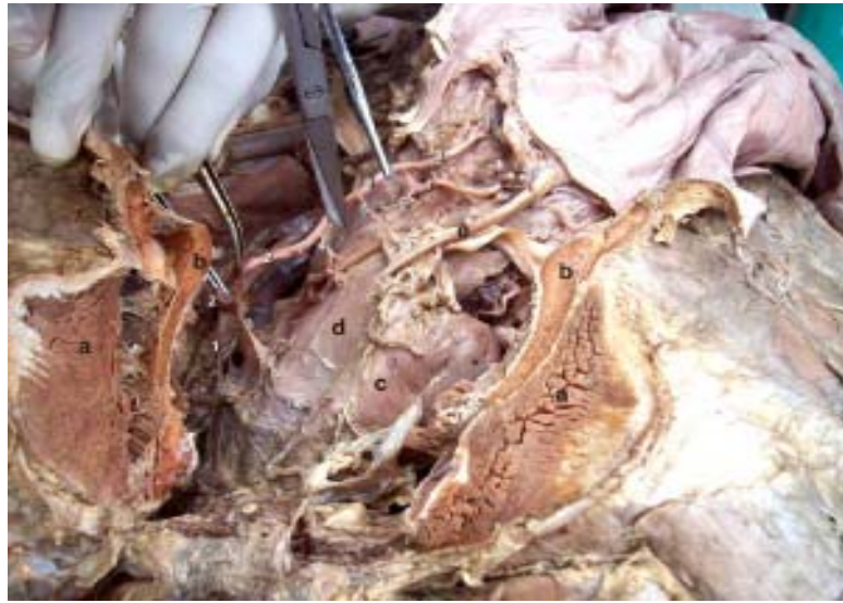
Figura 3. Vista ventro lateral de la cavidad pélvica mostrando las arterias que irrigan al aparato reproductor femenino de la llama. 1. Arteria Pudenda Interna; 2. Arteria Vaginal; 3. Arteria Vaginal Craneal; 4. Arteria Vesical Caudal; 5. Arteria Vesical Media; 6. Arteria Uterina Derecha; 7. Arteria Uterina Medial Derecha; 8. Arteria Uterina Lateral Derecha; 9. Arteria Arco Cervical; a. Músculo Gracilis; b. Sínfisis Isquio Púbrica; c. Vejiga; d. Vagina; e. Uréter Derecho.