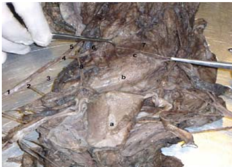
Figura 4. Vista ventro caudal del aparato reproductor femenino de la llama mostrando el patrón de irrigación arterial. 1. Arteria Vaginal Derecha; 2. Arteria Vesical Caudal; 3. Arteria Uterina Dorsal; 4. Arteria Uterina; 5. Arteria Uterina Lateral Derecha; 6. Arteria Uterina Medial Derecha; 7. Arteria Arco Cervical; 8. Arteria Vesical Media; a. Vejiga; b. Vagina; c. Cérvix.