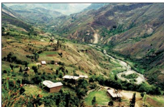
Figura 2. Vista panorámica del valle Llaucano.

exámenes de laboratorio efectuados e información complementaria si la hubiera. Así mismo se obtuvo información concerniente a datos de vivienda, como altitud, material de construcción, cultivos principales, animales domésticos y silvestres, protección antivectorial. La información obtenida se registró en fichas epidemiológicas y clínicas.