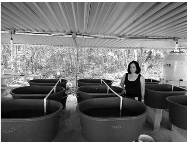
Figura 1. Área de cultivo de los caracoles Pomacea flagellata , para estudio de la preferencia de sustrato para la ovoposición de las huevas.

Los sustratos seleccionados fueron: raíces de mangle ( Rhizophora mangle ), tallos de carrizo ( Arundo donax ) y tubos de PVC (Fig.2). Los dos primeros son abundantes en la laguna de Bacalar, el ambiente natural de la chivita. Cuando una masa de huevo fue puesta en la pared de la tina, se registró como “pared”. Los sustratos se montaron en una base colocada en el centro de las tinas, cada uno tuvo una separación de 17 cm entre ellos, y una altura de 42 cm y los sustratos se distribuyeron de manera aleatoria en las bases (Fig.2). Los residuos de alimento y del metabolismo de los caracoles, se eliminaron por sifoneo cada dos días, restableciendo el volumen en cada tina. Los organis-