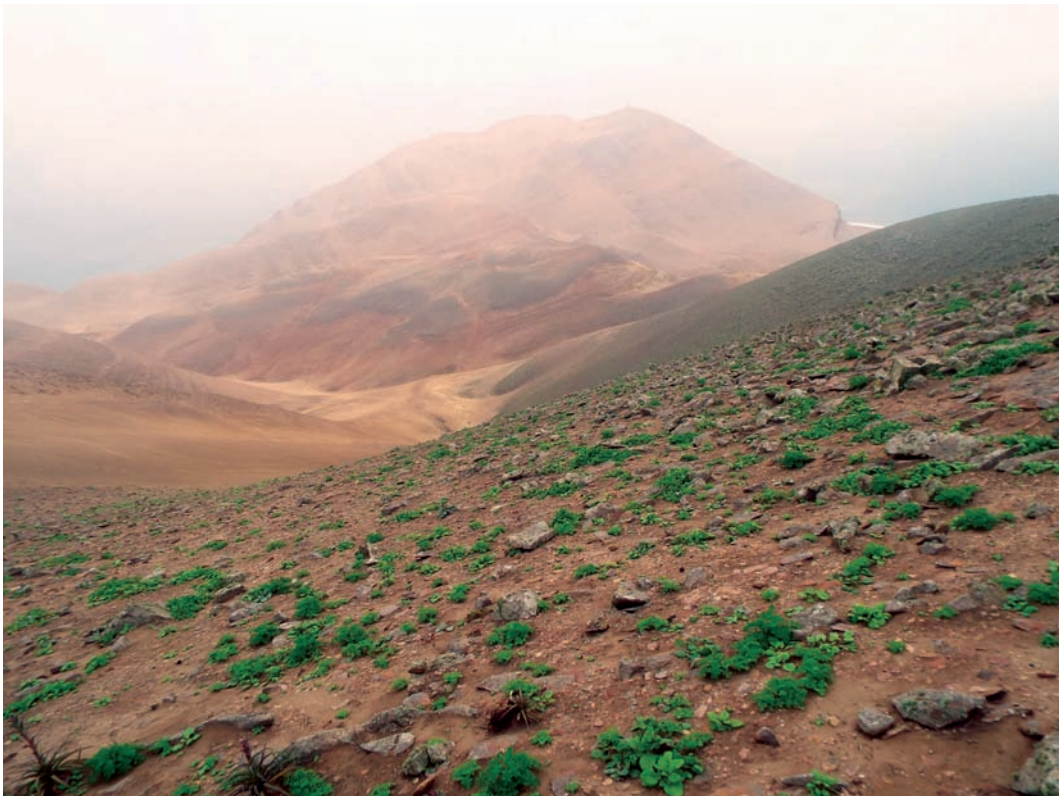
Figura 3. Hábitat de Lomas de herbáceas en la isla San Lorenzo, Lima, Perú. (Foto Miguel Lleellisch©).

nales son relacionadas a adaptaciones al sustrato del hábitat que ocupan las especies del género Phyllodactylus (Dixon & Huey 1970, Huey 1979), por lo tanto, esta probable variación en el tamaño de estas lamelas digitales podría estar relacionadas con los sustratos que estarían empleando los gecónidos en la isla San Lorenzo. Phyllodactylus microphyllus se distribuye desde el departamento de Tumbes hasta Lima, en el Desierto Costero (Carrillo & Icochea 1995). Este gecónido se presenta en zonas costeras de Perú, y también ha sido observado en ambientes urbanos (J. Pérez observación personal).