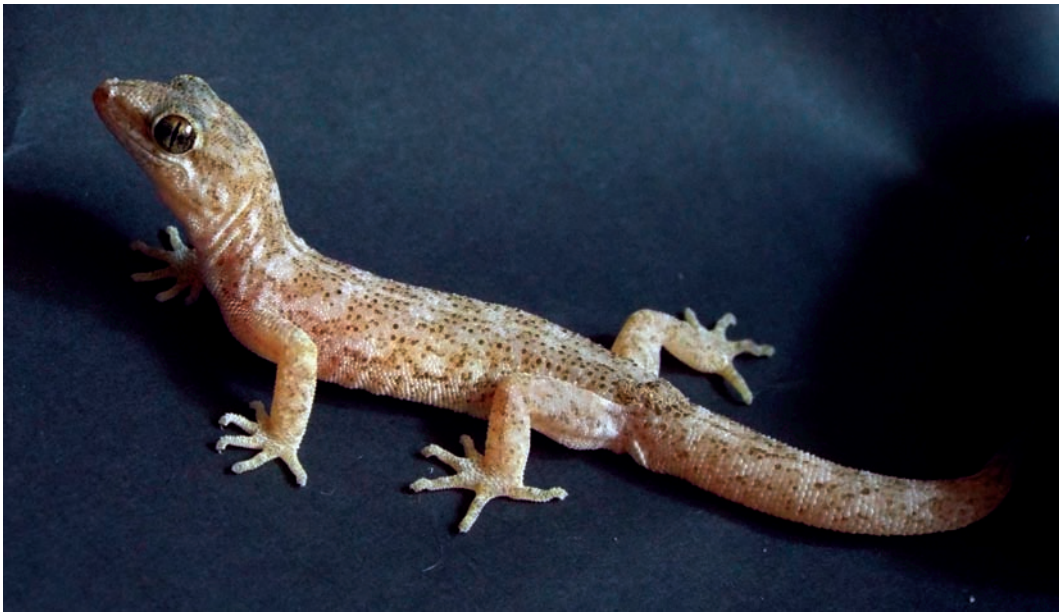
Figura 2. Gecónido Phyllodactylus cf. microphyllus (Reptilia: Phyllodactylidae).