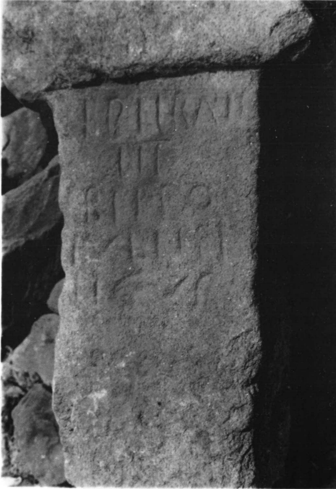
Fotografía N.º 1. ZORITA (Cáceres)

Dimensiones: Altura 75 cm. Anchura 37 cm. Grosor 27 cm. Neto inscrito 30 cm. Altura de las letras 5'5 cm. Anchura de la moldura superior 17 cm. Anchura de la moldura 47 cm.