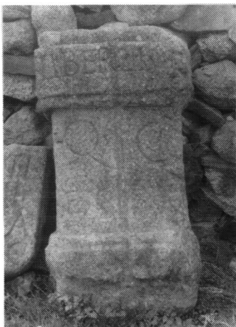
FOTOGRAFÍA N.º 2. «Aldehuela de Mordazo», TRUJILLO (Cáceres).

LIBER LIB [ era ] / Q (vintvs) C(aecilivs) [ ð Q (vintvs) [ et ] C (aivs) ] / EX V (voto).