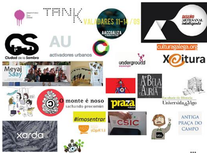
Fig. 7. Mosaico de la red que hemos ido tejiendo

colectivos que han ido aportando tiempo, ideas, cariño, ánimo, destrezas, habilidades pero sobre todo energía para hacer esto posible.