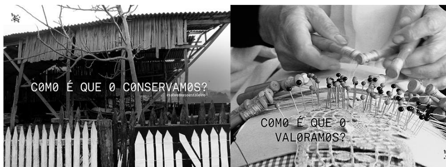
Fig. 2. Preguntas y elementos que convertimos en carteles

Pero, ¿cómo llevar esto a la práctica de una manera sencilla? Necesitábamos una metodología de trabajo para liberar este término e ir dándole vida. Intuíamos que era un concepto con definiciones múltiples y abiertas al que podíamos atribuirle la cita de Hakim Bey: