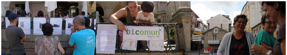
Fig. 6. Nada sería posible sin todo el mundo que se acerca, participa, sonríe y conversa

BIComún es un concepto en expansión, un proceso de experimentación y desarrollo que todavía está empezando y en la que han colaborado muchas personas y