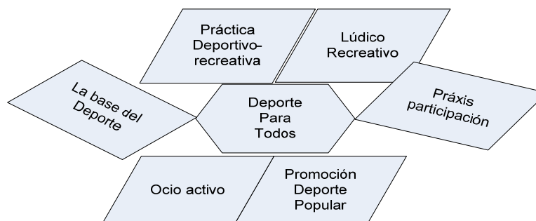
Figura 9: Manifestaciones de los sujetos en torno al Deporte para Todos.

En este sentido se percibe claramente entre las manifestaciones de los sujetos una concepción del Deporte ligada a lo lúdico, al ocio, cercana a la salud, a los hábitos saludables, y sobre todo, se presenta como una alternativa para la ocupación activa del tiempo libre. Vemos una clara alusión a un deporte inclusivo, no selectivo, fundamentado en aspectos educativos, que busca la dimensión recreativa del ser humano, y es atendido de forma multidisciplinar. En este sentido encaja con estudios como los de García Ferrando (2001), que señalan que la mayoría de los ciudadanos que hacen una práctica deportiva lo hacen para divertirse.