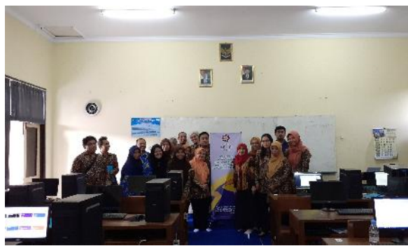
Gambar 6. Penutupan