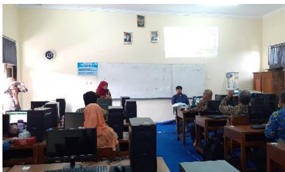
Gambar 5. Sesi tanya jawab