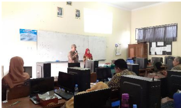
Gambar 3. Sambutan dari pihak sekolah

Disesi terakhir pelatihan, peserta diberikan contoh penugasan untuk mengevaluasi keberhasilan pelatihan yang telah dilakukan. Hasilnya peserta cukup memahami materi yang disampaikan dan dapat mengimplementasikannya dengan baik. Berikut ini beberapa gambar dokumentasi pelatihan yang telah diselenggarakan.