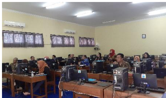
Gambar 4. Penyampaian materi