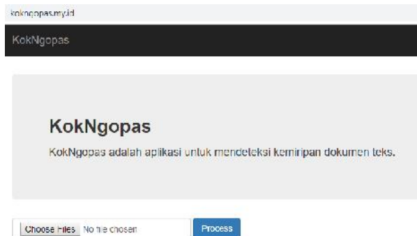
Gambar 1. Unggah file tugas

Pada bagian ini, peserta akan melakukan pengecekan file-file tugas siswa, file dapat diunggah sebanyak lebih dari 10 file seperti gambar di bawah ini.