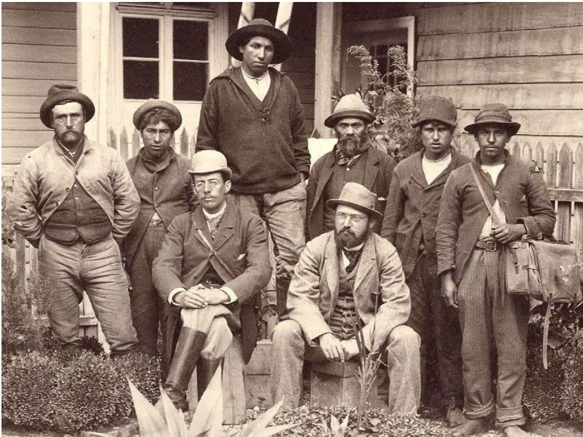
Abbildung 1: Hans Steffen (Dritter von links) mit seiner Expeditionsgruppe im Gebiet des Río Palena (Chile) (1893/94).