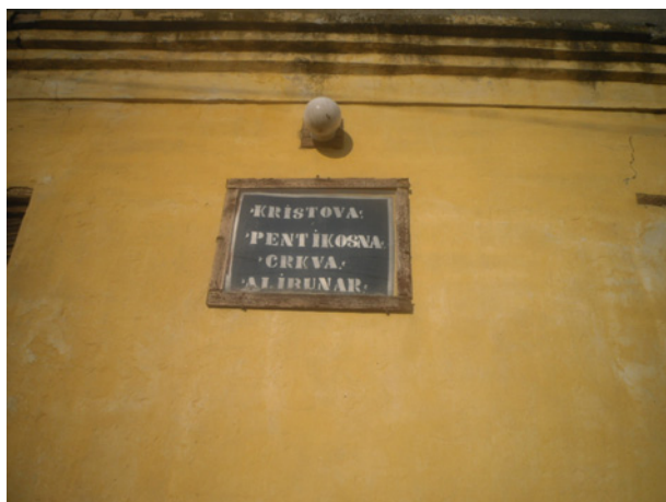
Pentekostalna crkva u Alibunaru