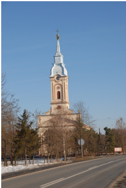
Rumunska pravoslavna crkva u Vladimirovcu

Konfesionalna realnost vezana je za pripadnost rumunskoj pravoslavnoj crkvi većine Rumuna u Banatu, ali i za prisustvo nekih neoproteštantskih zajednica i, najzad, grkokatoličke ili unijatske crkve.