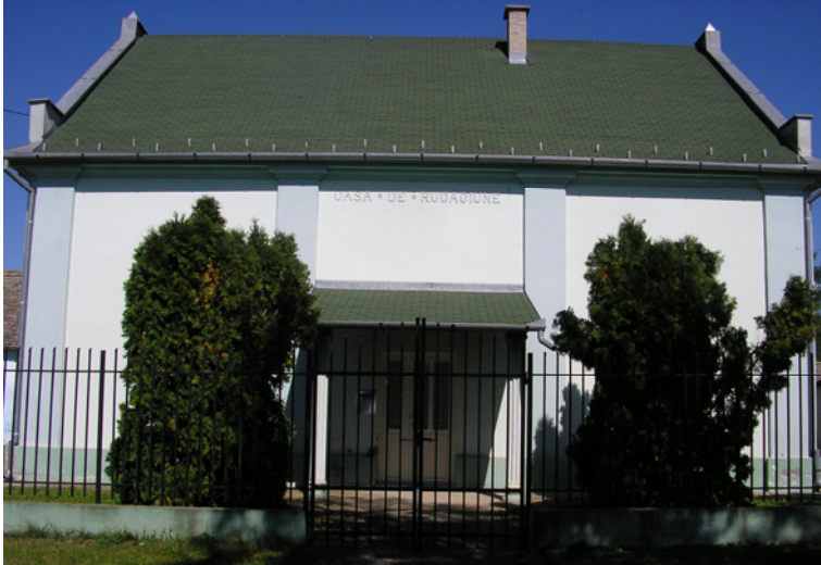
Rumunskanazarenska skupština u Uzdinu

jeziku. On će da dođe za njegov narod. Dolazi prvo On, na oblacima da pokupi njegovu skupštinu, ali ovi drugi još će ostati. Posle toga biće još mnogo teško, Bog će da pusti neku teškoću na ovaj drugi svet da bi se pokajali, ali neće biti mnogi. Ali ni to neće biti dugo i onda će biti kraj. Ne znam ja, samo Bog zna kako će biti to. Samo jedini Bog zna kako će biti kad Gospod dođe da skupi. 60