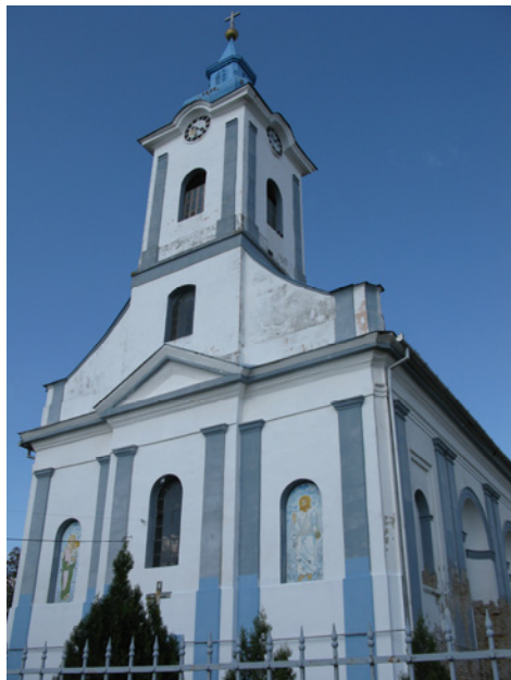
Rumunska pravoslavna crkva u Malom Torku

stvarnost, pošavši od parole bratstvo i jedinstvo , formira novu inteligenciju, verno jugoslovenskoj državi i novoj komunističkoj ideologiji, koja će u tom pravcu predvoditi i druge društvene slojeve svoga etnosa. U tom pogledu je politika koju su vodile posleratne komunističke vlasti dala očekivane rezultate, transformišući rumunsku manjinu u Banatu – do tada usmerenu ka matičnoj zemlji – u zajednicu lojalnu državi u kojoj živi. Ova situacija je prisutna i danas i posle raspada Jugoslavije. Rumuni u Srbiji i danas ostaju važan faktor njene unutrašnje i spoljne stabilnosti.