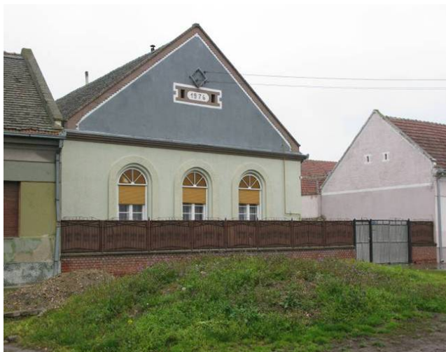
Rumunska nazarenska skupština u Lokvama