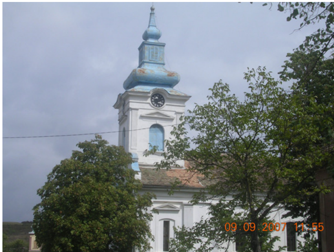
Rumunsk pravoslavna crkva u Markovcu

- I hor sa fanfarom, sve. - Sa fanfarom, sve, mi smo držali, ako je sahrana onda je celo selo. - Osam godina je išao osam kilometara preko Brega u Sočicu. BS: U Sočicu? I tamo su grkokatolici? - Ne. Nisu imali popa. Išao je. Pešice. - Pešice je išao, održao liturgiju i vratio se nazad.