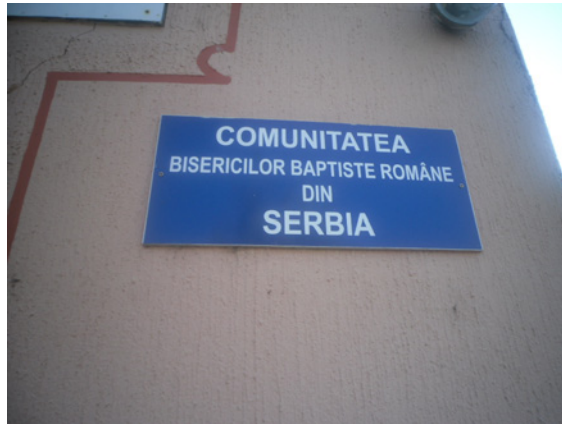
Zajednica rumunskih baptističkih crkava u Alibunaru

Na čelu svake lokalne baptističke crkve se nalazi pastor, koga biraju vernici, a osnovni kriterijum prilikom izbora je njegova zasluga u propagiranju vere i funkcionisanju zajednice.