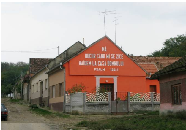
Baptistički molitveni dom u Mesiću

Hajde, dobro je da se bilo gde moliš dobrom Bogu. Ja ne jedem dok se pre toga ne pomolim. Svako veče se molim za kuću zbog zla, nesreće i neprijatelja.