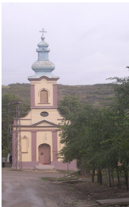
Rumunska grkokatolička crkva u Markovcu

Kao poslednja ilustracija odabran je transkript spontanog, neformalnog razgovora trojice sagovornika iz Markovca o fizičkom stanju rumunskih pravoslavnih i grkokatoličkih crkava i kapela u Banatu, vođen septembra 2007. U pitanju je interakcija trojice starijih sagovornika koja za dijalektološki orijentisanu sociolingvistiku i istraživanje razgovornog jezika ima izuzetnu vrednost. Istraživač ovde nije aktivan, on je samo osoba koja čeka da kolege dijalektolozi u službenoj prostoriji završe svoj deo posla kroz institucionalne intervjuue. Nesporno je da prisustvo istraživača, koga zanima stanje rumunskog jezika i kulture u selu, generiše insajdersku razmenu stavova i pokušaj da mu se objasni svim sagovornicima dobro poznata trenutna situacija. Istraživač u navedenom odlomku interveniše samo jednom, iznenađen njemu nepoznatom informacijom o služenju grkokatoličkog sveštenika u rumunskoj pravoslavnoj crkvi u Sočici.