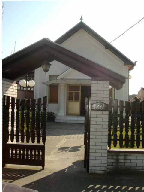
Adventistička crkva u Lokvama

kana. Tokom 2008. godine, ukupno 25 propovednika adventista iz Rumunije propovedalo je adventizam među Rumunima u Banatu. 23