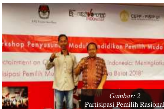
Gambar: 2 Partisipasi Pemilih Rasional

Salah satu elemen kunci dalam teori ekonomi Downs dan para penerusnya tentang demokrasi, menurut Yustiningrum dan Ichwanuddin 12 adalah bahwa arena pemilihan umum itu seperti sebuah pasar, yang membutuhkan penawaran (partai) dan permintaan (pemilih). Dalam