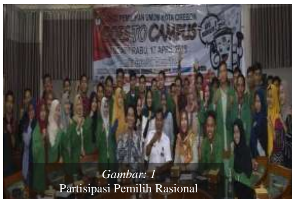
Gambar: 1 Partisipasi Pemilih Rasional

Model ketiga dari perilaku masyarakat Indonesia dalam politik merupakan kombinasi dari kedua modal tersebut di atas. Ada pergeseran dalam studi perilaku memilih ke model yang lebih menekankan individu warga negara sebagai aktor yang relatif mandiri dari partai dan struktur kolektif serta ikatan kesetiaan lainnya 11 . Teori model rasional ( rational-choice ) yang diperkenalkan pertama kali oleh Anthony Downs sebenarnya tidak hanya terbatas pada studi pemilu. Ia menulis bagaimana demokrasi “diukur” dengan menggunakan pendekatan dalam ilmu ekonomi.