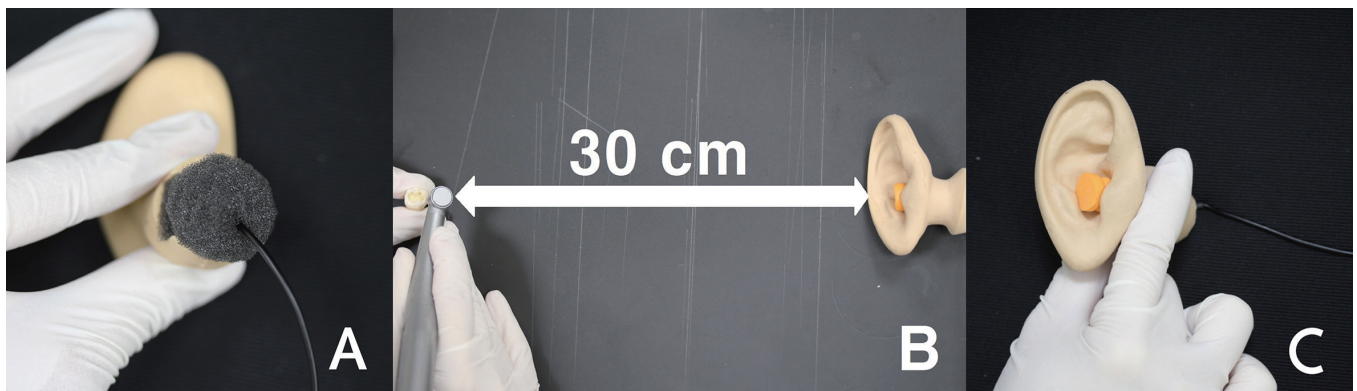
Fig. 1. (A) The portable microphone was connected to the inner ear of the model and the connection area was sealed with a sponge, (B) The level of noise was measured in various conditions from the distance of 30 cm with a portable noise mete, (C) Noise level was measured again after the application of noise cancelling devices.