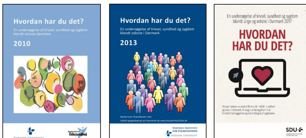
Figur 1. Spørgeskemaer fra Sundheds- og sygelighedsundersøgelserne i 2010, 2013, 2017.

Denne artikel vedrører primært resultater fra projektdel A, som fokuserer på analyser af SUSY-data. I afsnittet om etageboligbyggeri i Danmark er vist de nye lydklasser for ældre boligbyggeri, men øvrige projektresultater publiceres separat.