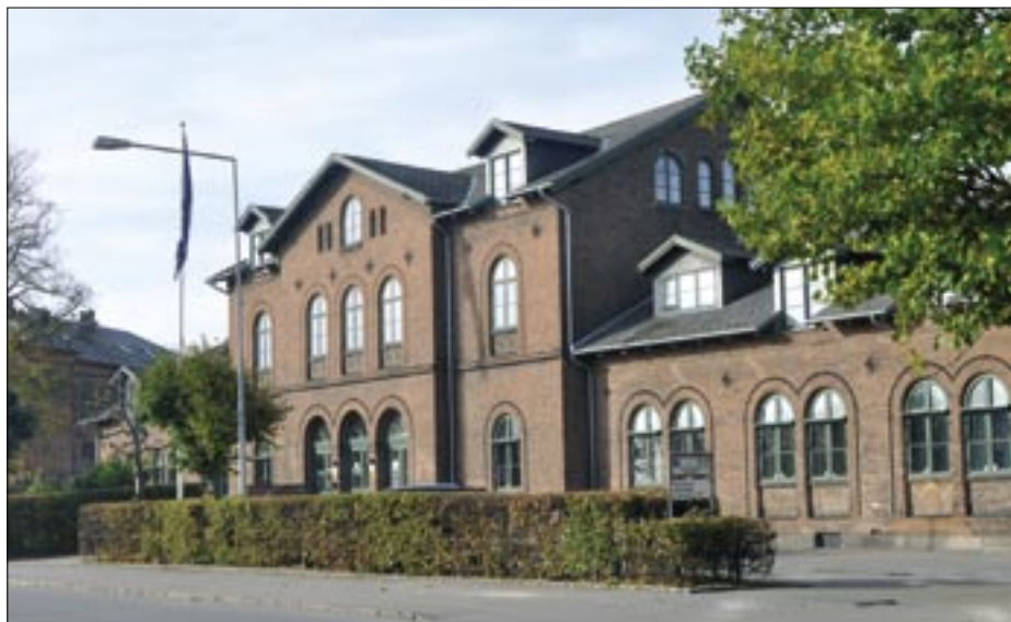
Helsingørs oprindelige station ligger vest for byens centrum. I dag rummer den almene boliger.

Helsingørs første banegård, der indviedes sammen med Nordbanen, Kjøbenhavn – Hillerød – Helsingør den 9. juni 1864, var beliggende vest for bymidten – en beliggenhed der var valgt ud fra taktiske og økonomiske hensyn, mere end ud fra trafikplanlægningshensyn. Byen frygtede, at en del af handelen ville »flytte« til Kjøbenhavn hvis jernbanen lå i selve bymidten. Men også fordi Helsingør var søfartens by, og man frygtede, at jernbanen ville skade søtransporten. »...søveien til Kjøbenhavn er 5 mil, banen 8 mil. Ba-