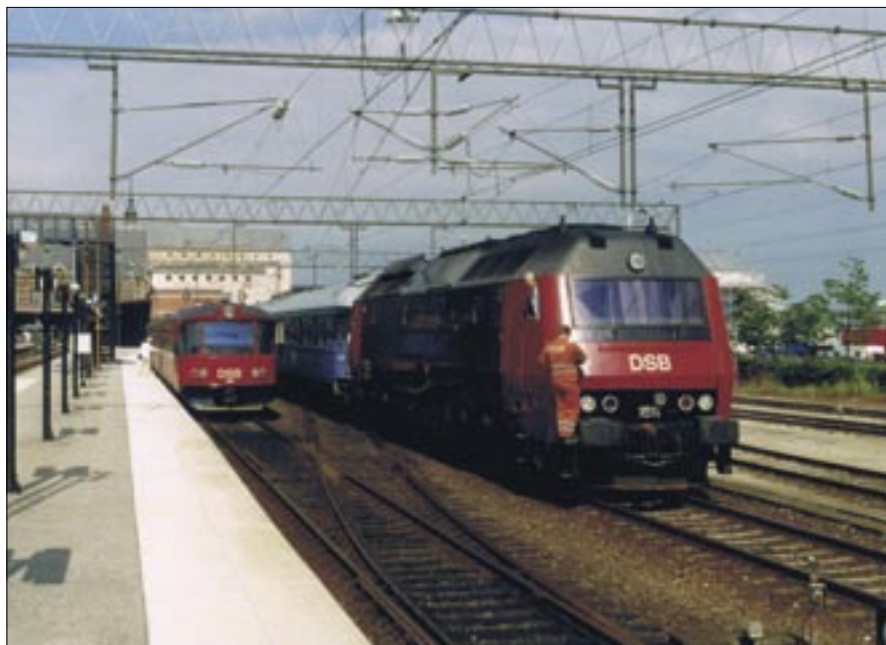
De gennemgående personvogne i dagtoget fra Stockholm er hentet på færgen, og ME 1511 trækker her op på stationen med vognene den 21. juli 1999. Til venstre ses i spor 0 et af DSB's Y-tog klar til afgang mod Hillerød. Hos DSB havde Y-togsmotorvognene litra ML og mellemvognene litra FL, og de kørte hos DSB kun på Lille Nord, som strækningen Hillerød – Helsingør kaldes.