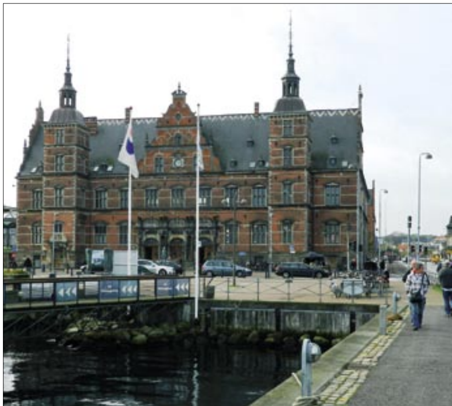
Helsingørs anden banegård er opført i den såkaldte Rosenborg-stil. Her er den set fra havnesiden den 17. oktober 2012.

Helsingør Station er en såkaldt rebroussementstation, eller i daglig tale en sækbanegård eller sækstation, som betyder, at hovedsporene ender blindt. For at togene kan køre videre, må man foretage en retningsændring – rebroussere – køre ind og ud til samme side, hvilket med lokomotivtrukne tog dengang betød, at lokomotivet skulle køres til den anden ende af togstammen, og i de fleste tilfælde endog vendes på drejeskiven før der kunne returneres. Drejeskiven var dog ikke nødvendig for de maskiner, der specielt var bygget til at køre lige så godt forlæns som baglæns, eksempelvis litra O og litra S. Selv med diesellokomotiverne skulle der også omkringkøres. Omkringkørslen forsvandt, da