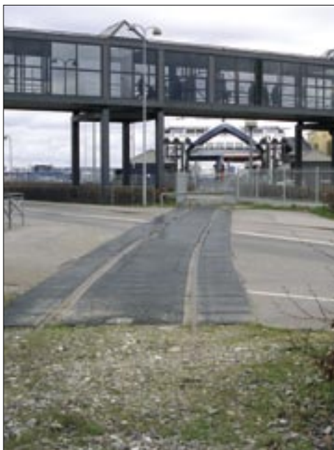
Det er slut med at overføre jernbanevogne på Scandlines færger mellem Helsingør og Helsingborg. Således så sporet til færgekappen ud den 7. april 2007.