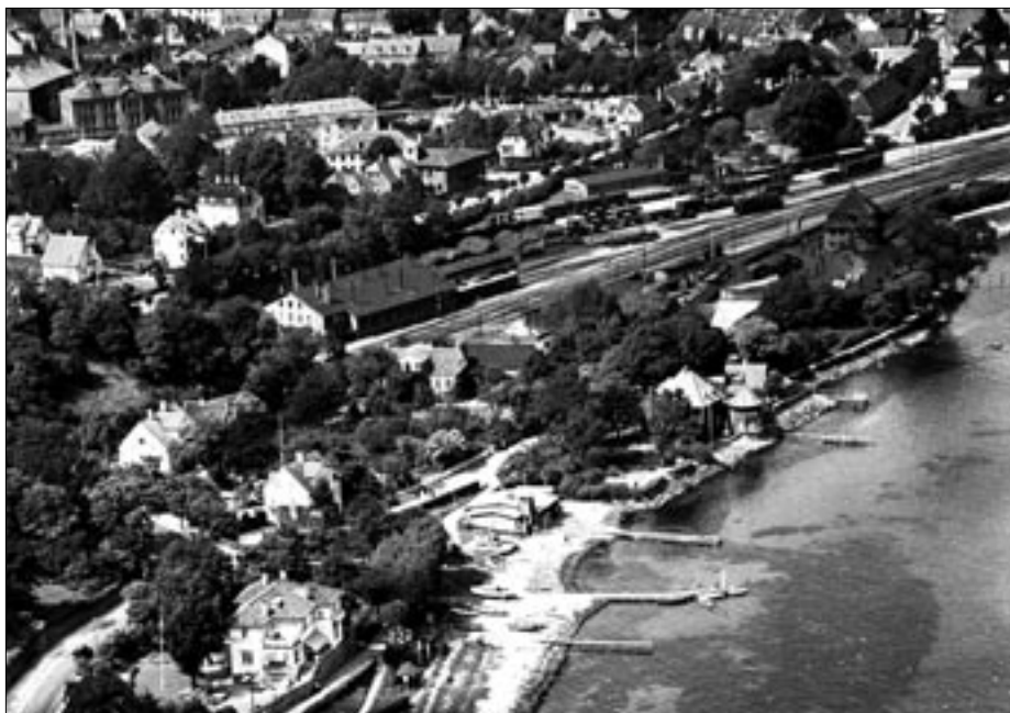
Arealet med den gamle firkantede og den nyere rundremise set fra sydøst.

en hvidkalket bygning. Pumpehuset kan ses på sporplanerne, og er benævnt »Pumpehus«.