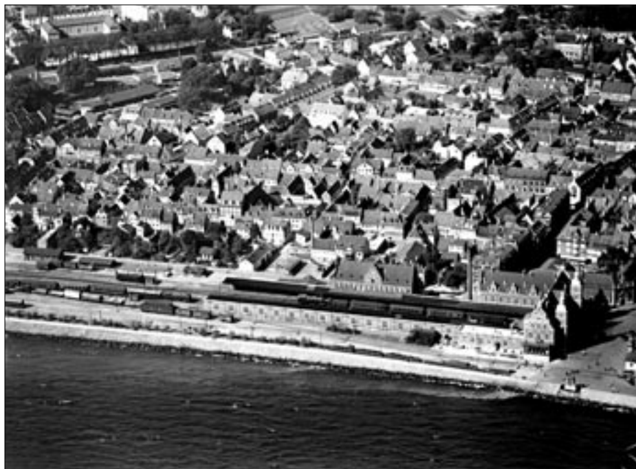
Helsingør Station set fra luften 1936. Den lange læmur ud mod Øresund ses tydeligt. I spor 3 holder en bagvendt S-maskine klar til afgang med et tog mod København.

Stationens sidebygning, kedelbygningen, posthuset og ilgodspakhuset virker som én sammenhængende bygning, når man står på perronerne. Bygningerne er dog selvstændige bygninger, som er forbundet med læmure, som sammen med bygningerne danner en bagvæg for den overdækkede perron – perron 3. Midterperronen har ikke overdækning. Men disse sammenbygninger, stationsbygningen