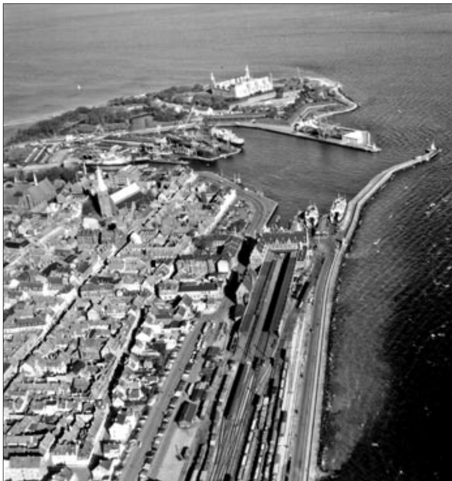
Helsingør set fra syd 1956.

Tog til Helsingør kunne godt have mere end de 90 aksler, men så skulle toget adskilles før det blev kørt ind på sporene. Så begrænsningen var sikkert på grund af de korte sporlængder i Helsingør. Toget holdt ved indkørselssignalet og blev delt i to, og blev så rangeret til ankomstsporene.