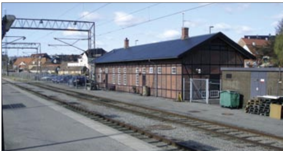
Pladspersonalets »borgerstuen« i Helsingør den 7. april 2007.

Næstfølgende ligger opholdsbygningen – borgerstuen – for stationspersonalet, det vil sige væsentligst rangerpersonalet – altså portørerne, for lokomotivførerne