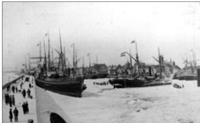
Statshavnen med blandt andet skibet Esbjerg i vinterhi marts 1888, året hvor DSB overtog overfarten til Hålsingborg. Postkort.