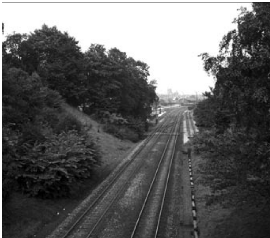
Nordbanen og Kystbanen føres ind til Helsingør gennem en stor udgravning af Flynderborgbakken. Jord herfra blev brugt til opfyldning i Trykkedamsbugten. Sammenlign i ørigt gerne med billedet side 23 øverst. Foto 1952.