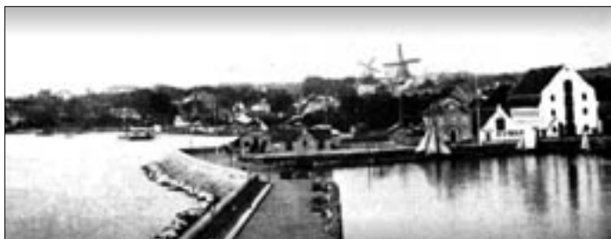
Helsingør Havn og Trykkedamsbugten før byens anden banegård blev bygget. Midt i billedet ses Strandpavillonen, som også er gengivet på postkortet til højre. Den blev revet ned 1890 i forbindelse med byggeriet af den anden banegård. Postkort