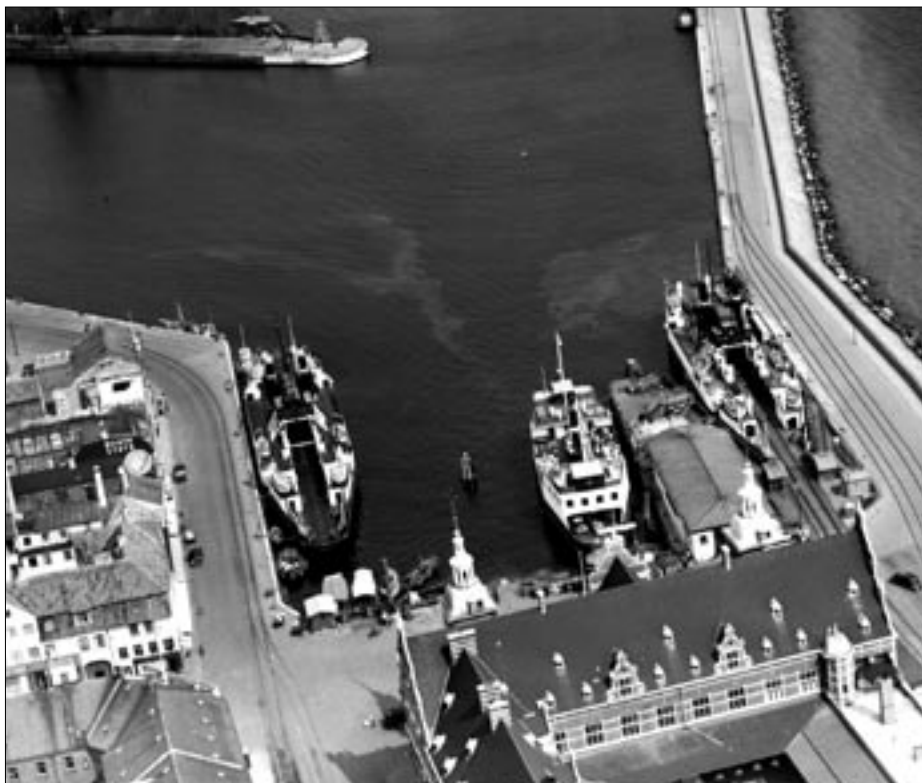
Færgehavnen i Helsingør 1936. Færgen i midten er den særlige bilfærge M/F Kronborg.

Som nævnt tidligere, så har godstrafikken været den alt dominerende trafik i Helsingør på grund af transittransporten til Sverige og Norge og fra disse lande til Europa. På et tidspunkt var man oppe på at sejle med seks færger på de to jernba-