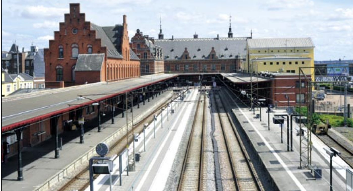
Helsingør Station er en sækbanegård. Hvad det indebærer, ses ganske godt på dette billede fra 11. juli 2018.

en sækbanegård med liv – og med et hul i sækken