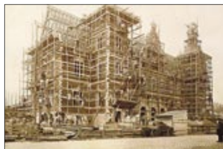
Helsingørs anden banegård under opførelse med mange arbejdere på stilladset. Postkort.

Da hovedbygningen skulle etableres på gammel havbund og opfyld, måtte bygningerne piloteres, og til banegårdens fundering nedrammedes efter sigende