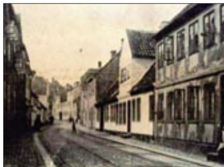
Den første havnebane, kaldet Trækbanen, løb gennem Kongensgade. Sporet ses midt i brolægningen.

nens trafik er – uanset concurrencen med søveien – forholdsvis betydelig. De senere år er der befordret ca. 60.000 passagerer med jernbanen til Helsingør«. (Thomassen, 1972).