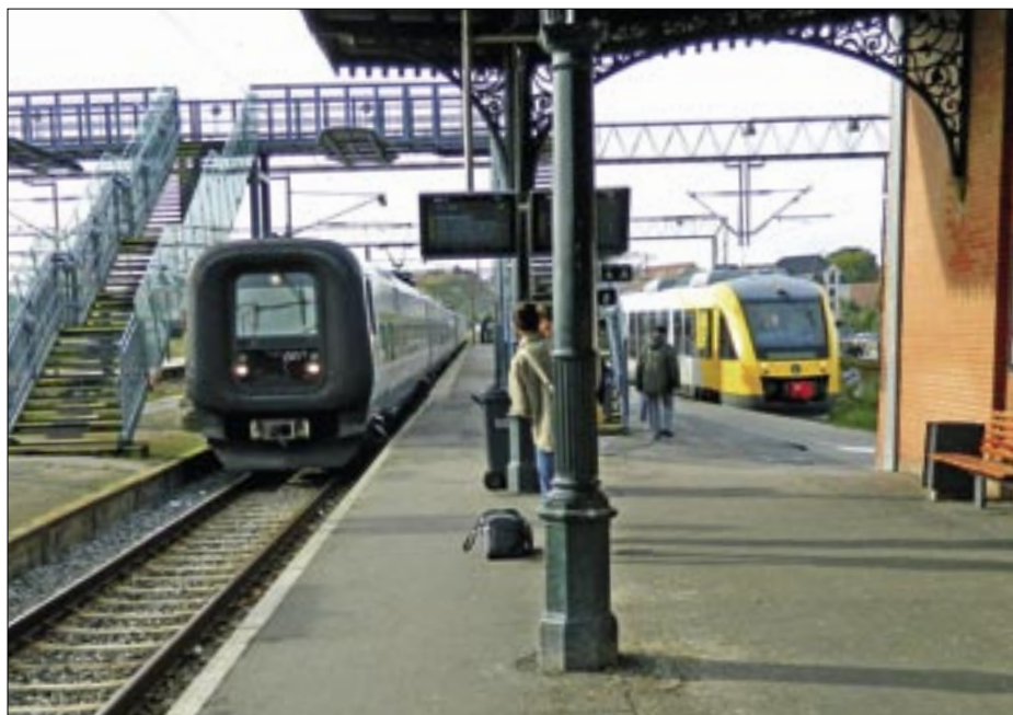
Perronstemning på Helsingør Station. I spor 3 ankommer et øresundstog fra København, og til højre afventer Lokalbansens Lint-tog mod Hornbæk. Foto den 7. april 2007 af Henning Knudsen

på tværs og læmuren mod Øresund, forstærker som nævnt indtrykket af, at man kører ind i en sæk.