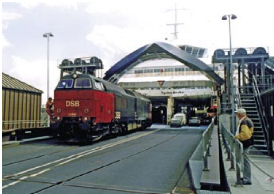
Efter godstrafikken blev overflyttet til DanLink-ruten Helsingborg – Københavns Frihavn, forsvandt rangerlokomotiverne fra Helsingør, og i de sidste år blev de gennemgående personvogne derfor rangeret til og fra færgerne med toglokomotiverne. Herover har MZ 1456 den 16. juli 1999 rangeret de svenske personvogne i dagtoget til Stockholm Centralstation ombord på færgen Tycho Brahe. Herunder er det ME 1511, som henter vogne i dagtoget fra Stockholm til København den 21. juli 1999. Billedet er taget oppe fra gangbroen for passagerer fra færgen.

Men indførelsen af Danlink-overfarten, 1986-2000, og Øresundbroen fra 2000, var stationens dage talte, og den store forandring begyndte. Nu om dage er der kun ganske lidt tilbage af stationen ud over stationsbygningen og posthuset. Derudover ligeledes kommandoposten, som stadig er i brug, men hvis dage også er talte, og den fredede borgerstue i bindingsværk. Vandtårnet står der endnu, men er nu beboelse. Alt andet er borte – dødt og begravet og glemte.