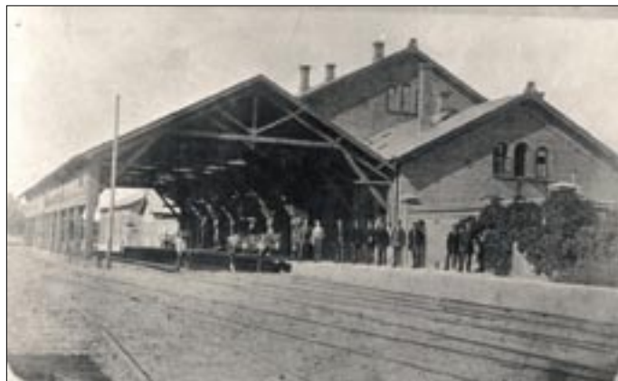
Den oprindelige station i Helsingør var forsynet med en vognhal, som rakte over to spor i bredden. Bemærk rangerhesten.

Den kommission, der arbejdede med et lovforslag til ændring af banen, havde også skelet til, om det var muligt at lave en kystbane på den danske side af Øresund, i stil med den svenskerne var ved at anlægge. Den 30. marts 1889 vedtog Rigsdagen loven om at anlægge en ny banegård ved havnen og et nyt færgeleje, samt til at anlægge en ny linjeføring af banen for de fire km fra Snekkersten Stations sydende til Helsingørs ny banegård. Stationen skulle placeres på havnens sydside ved