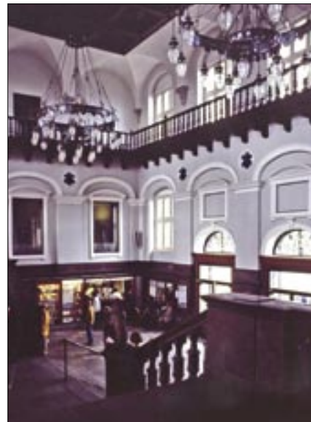
Den pompøse forhal set fra indgangen fra perronerne.

Stationsbygningen ligger på tværs for enden af sporene, og på grund af terrænforskel mellem sporarealerne og forpladsen ved havnen, skal man fra perronerne på »første sal« gå ned ad de brede trapper i den store og imponerende forhal til ga-