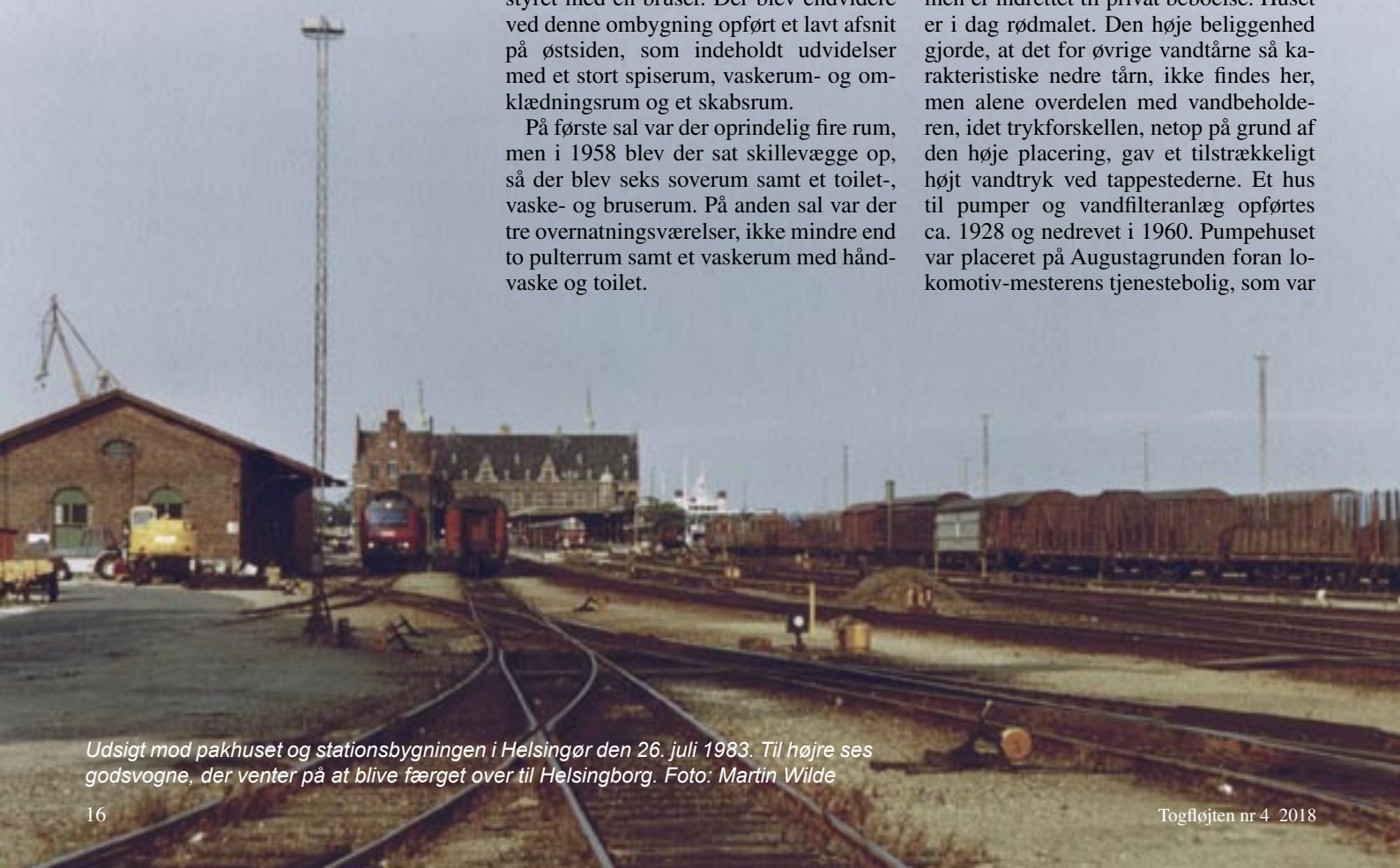
Udsigt mod pakhuset og stationsbygningen i Helsingør den 26. juli 1983. Til højre ses godsvogne, der venter på at blive færged over til Helsingborg.

Sydvest for remisen blev der, på en kunstig bakke ovenfor banens gennemskæring ved Flynderborgvej, i 1890/91, opført et lavt tolvkantet vandtårn med et næsten fladt tag. Mellem remisen og tårnet henligger fortsat en ubebygget grund med brønde. Filterhus med tilhørende maskinhus og kedelhus blev opført 1892 og nedrevet 1960. Tårnet består stadig, men er indrettet til privat beboelse. Huset er i dag rødmalet. Den høje beliggenhed gjorde, at det for øvrige vandtårne så karakteristiske nedre tårn, ikke findes her, men alene overdelen med vandbeholderen, idet trykforskellen, netop på grund af den høje placering, gav et tilstrækkeligt højt vandtryk ved tappestederne. Et hus til pumper og vandfilteranlæg opførtes ca. 1928 og nedrevet i 1960. Pumpehuset var placeret på Augustagrunden foran lokomotivmesterens tjenestebolig, som var