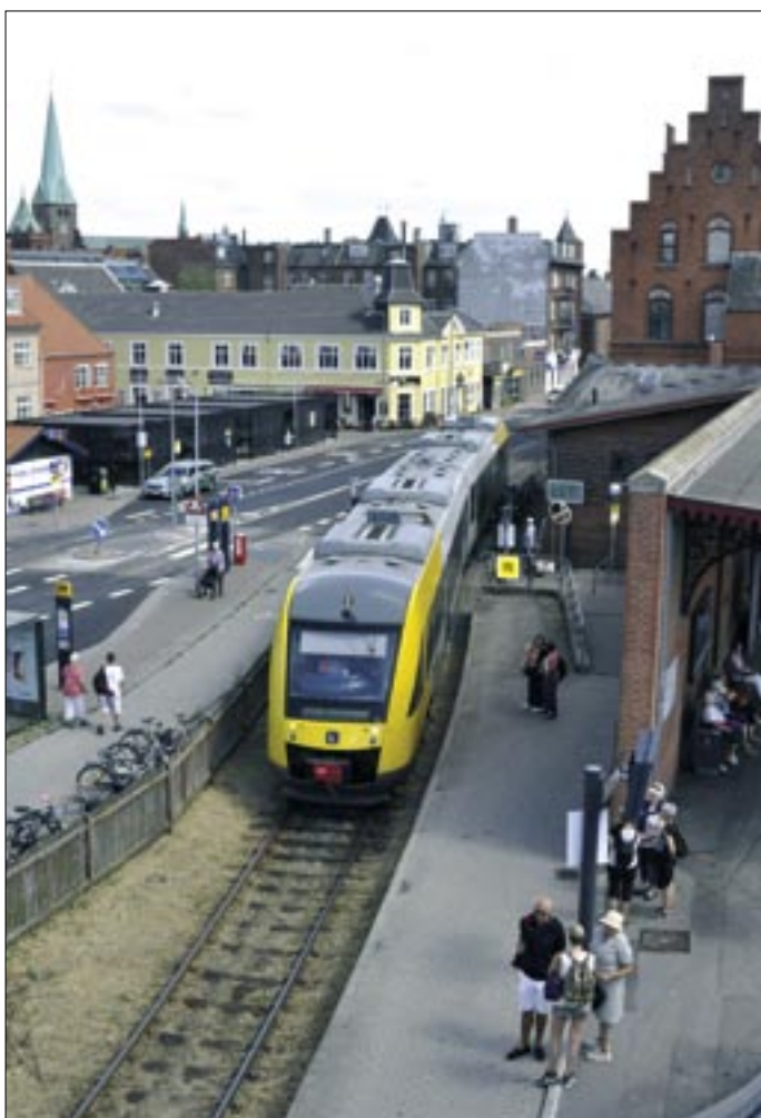
Udover jernbanefærgeruten til Helsingborg har sækbanegården Helsingør siden 1906 haft et andet hul i sækken, nemlig Hornbækbanen. I mange år havde Hornbækbanens persontog perron i gaden langs Toldboden, lige overfor stationen, men i 1990 blev sporet lagt over i den modsatte side af gaden, og Hornbækbanens tog har nu perron på bagsiden af perron 3. Jan Forslund fotograferede Lokaltogs Lint-tog ved ankomst den 11. juli 2018