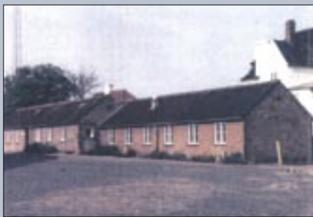
Banetjenestens bygning, kolonnehus for 8. banemesterstrækning

baneformand og banenæstformand havde kontorer. Banetjenesten havde ansvar for sporene, bygning af spor og vedligeholdelse heraf, samt for vognomlæsning, mv. I baggården var der overdækkede opbevaringspladser – både åbne og lukkede, og det var her, de havde tjenestens materiel liggende i depot.