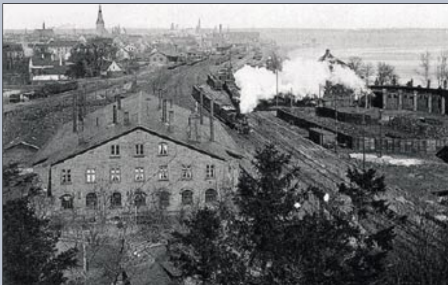
Den gamle og den nye remise samt kulgård cirka år 1900. Den resterende del af Villa Augusta skjules af røgfanen fra det afgående tog. Postkort

I remisebygningen var der foruden servicerrummene lokaler til forskellige formål. På mange måder beskriver disse lokaler også noget om opdeling af for-