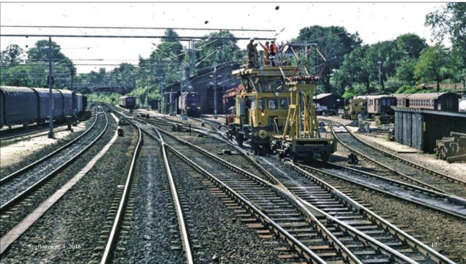
Lokomotivførerens udsigt ved udkørsel fra Helsingør Station sommer 1984. Til højre er personalet på en tårnvogn ved at montere luftledninger og bag den ses den oprindelige remise fra 1891.

Augusta af Hessen, som boede der indtil sin død i 1889. Statsbanerne købte grunden fordi DSB efter Kystbanens åbning i 1897 havde brug for mere remiseplads. Hovedparten af bygningen blev revet ned. Kun en lille del af pakhuset blev stående, og denne blev efterfølgende anvendt som opholdsbygning for lokomotiv- og maskinpersonalet.