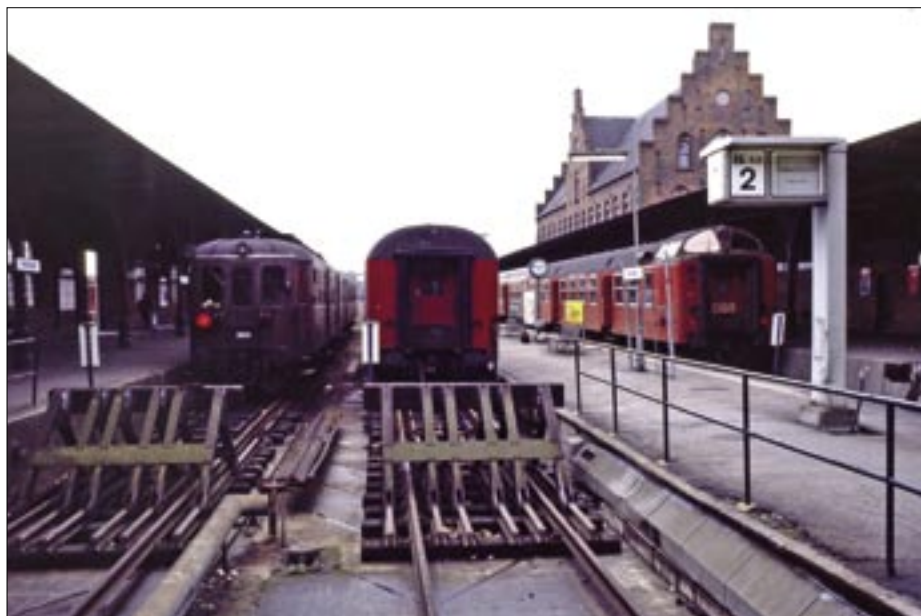
Oprindelig kunne der laves omløb ved perron gennem det midterste spor, men da den tredje perron med spor 2 blev etableret, faldt denne mulighed væk.

man begyndte at indsætte styrevogne i togene. På Nordbanen havde man i længere tid anvendt denne oprangeringsform.