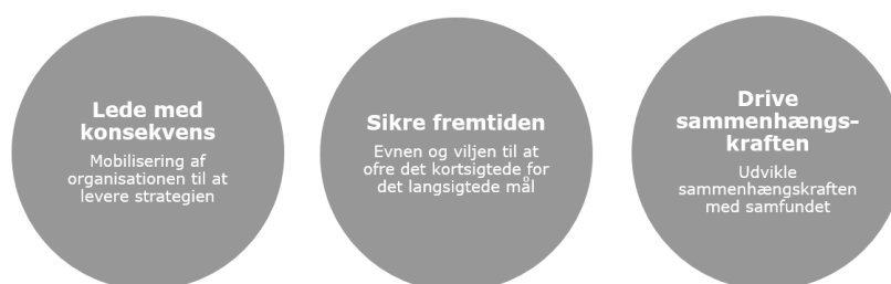
Figur 2. De tre karakteristika, som alle stewardship-ledere deler.

Ledere er både menneskelige og sårbare over for hovmod i forhold til vækst, profit og succes. Sårbarheden bliver måske større i takt med, at verden bliver stadigt mere forbundet, og som leder er det let at lade sig påvirke af nye tendenser og strømninger i et stort hav af muligheder. Ledere kan dermed blive ofre for deres egen succes eller bliver fortryllet af egne synspunkter. Hvis man vil være en virksomheds steward, må man derfor have dyb indsigt i virksomhedens historie, udvikling og værdier.