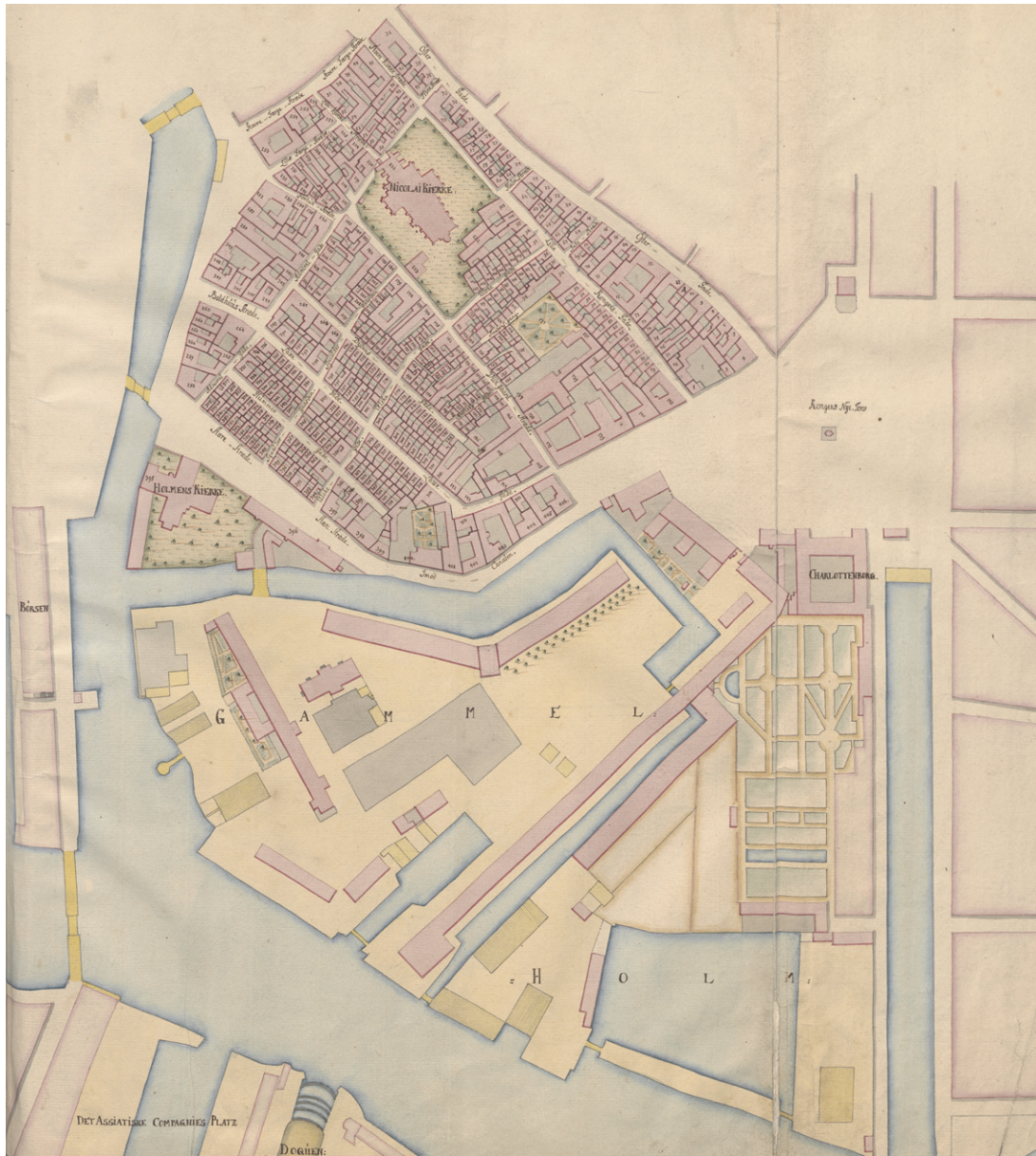
Kart over distriktet Øster i København i 1757. På kartet ser man Gammelholm, tidligere kalt Bremerholm. Tegnet av Christian Gedde.