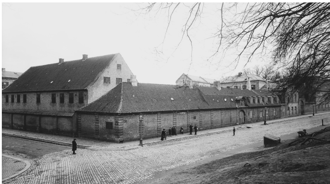
Fra 1741 sonet fanger som var dømt til tvangsarbeid og slaveri blant annet i Københavns Stokhus.