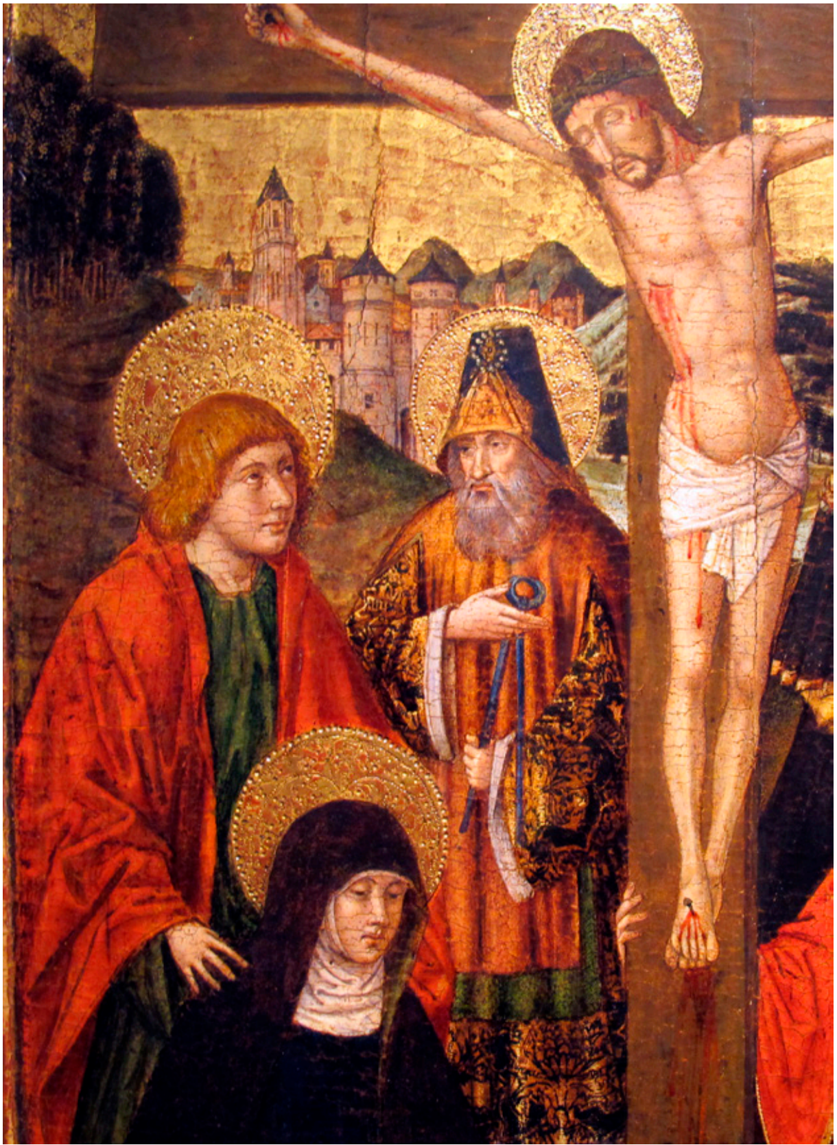
Jacomart, Crucifixión (detalle). Colección privada (Italia).