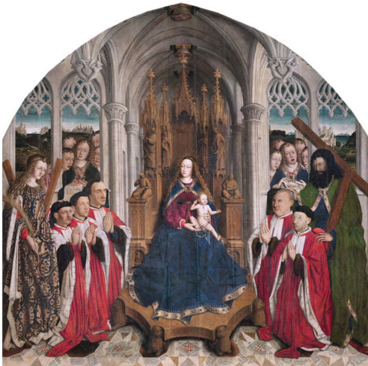
Lluís Dalmau, Mare de Déu dels Consellers . Museu Nacional d'Art de Catalunya.

Jacomart pertenece de lleno a esa tradición medieval que pretendió –y logró– hacer del arte un instrumento del universalismo católico, cuando los ideales religiosos todavía eran el lazo de unión entre el individuo y la sociedad.