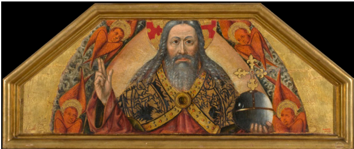
Joan Reixach, Padre Eterno . Museu Nacional d'Art de Catalunya.