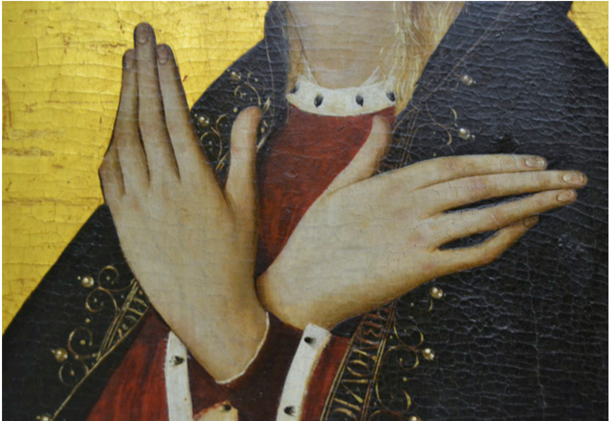
Jacomart, Anunciación (detalle de las manos de la Virgen). Museo de Bellas Artes San Pio V de Valencia.

trocentista italiana de corte protorrenacentista, encontramos dos figuras señeras. Por una parte, el pintor Jaume Baço, Jacomart, sobre el que Aguilera escribirá en 1954 y 1961 4 sendos espléndidos ensayos (al respecto de los cuales volveremos más adelante); y por otra, su discípulo Joan Reixach.