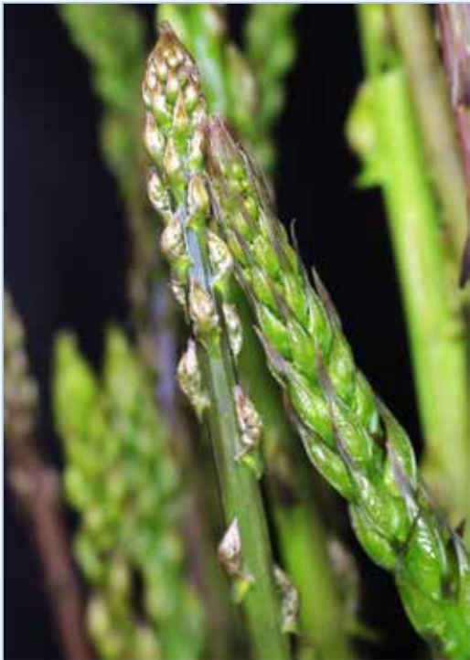
FIGURA 13. Espàrrecs d'esparreguera vera o comuna ( Asparagus acutifolius , a l'esquerra) i de gatmimo ( Tamus communis , a la dreta).

* Família Plantaginaceae. S'usen les fulles en ensalada de diverses espècies del gènere Plantago L., riques en vitamines A, C i calci, així com en mucíl·lags que ajuden al trànsit intestinal.