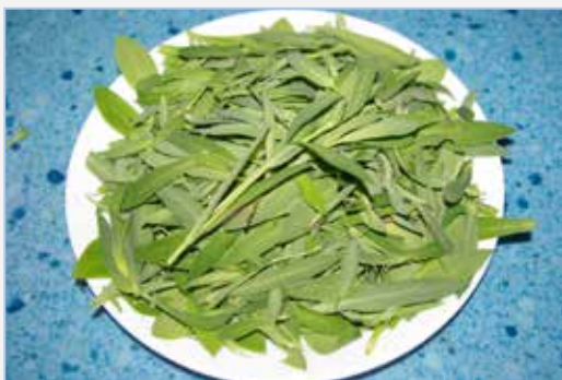
FIGURA 2. Fulles de colitxes, fardolets o conillets ( Silene vulgaris ), una de les verdures més apreciades per afegir en fresc a les ensalades.

Les ensalades camperestres no s'han extingit del tot al territori valencià, sinó que segueixen consumint-se esporàdicament en l'àmbit rural, sobretot la gent d'edat més avançada, que hi troba un altre element d'autoidentificació, en reconèixer sovint sabors i matisos culinaris que els fan recordar la seua joventut o infantesa. L'abandó que ha patit l'ús i recol·lecció de les verdures silvestres, podria contrarestar-se si tenim en compte els interessants elements de desenvolupament sostenible que poden representar en algunes àrees rurals valencianes, donat que el seu ús permet la reconstrucció d'una peculiar gastronomia -diriem endèmica, emprant un terme netament botànic- que, convenientment adaptada, podria esdevindre un element afegit de reclam ecoturístic i d'autoreconeixement de la societat rural. Cal destacar addicionalment el seu valor natracèutic, ja citat més amunt, a part de l'avantatge que suposa l'ampliació de l'espectre de sabors i l'absència d'elements químics adversos, més bé