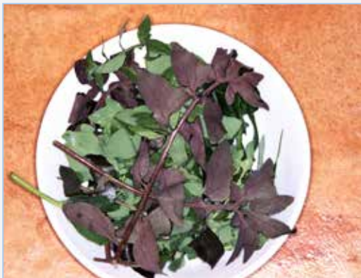
FIGURA 3. Collita de fulles de llicsons, Sonchus tenerrimus , amb diferents colors. Figura: E. Laguna.

♦ Calendula officinalis L. (boixac, pet de frare, caléndula , maravilla ): les seues flors de color taronja s'incorporen com un atractiu visual a les ensalades, a les quals aporten una acció colerètica i estimulants