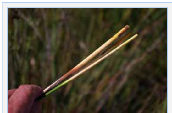
FIGURA 12. Collita de la base de les tiges del jonc boval ( Scirpus holoschoenus ), mostrant la part blanca comestible.

Els brots florals i les flors joves d'aquesta espècie, així com les de Lavatera cretica L. (formatgets, malva loca ), L. maritima Gouan (malvera blanca, malva blanca ), i de L. arborea (malvió, malva arborea ), es fiquen en les ensalades pel seu sabor suau, per les propietats