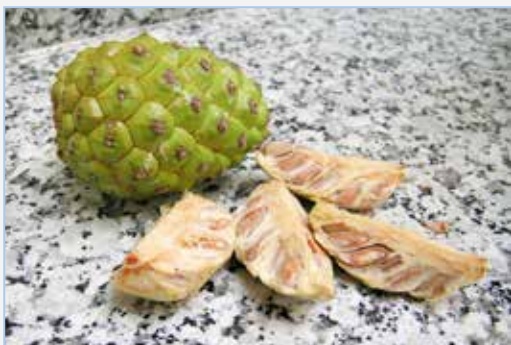
FIGURA 15. Gallons de pinya de pi pinyoner ( Pinus pinea ) ja amanits per a adobar-los en aigua-sal.

* Família Ulmaceae. Grans arbres forestals del