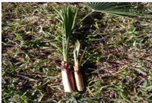
FIGURA 9. Medul·la o 'cor' del margalló ( Chamaerops humilis ), abans de llevar-li les fibres externes.

♦ Asparagus horridus L. (esparreguera amarga, espàrrago amargos ): és una esparreguera freqüent en orles de llentiscars, coscollars i matollars secs de les comarques litorals. També se la veu créixer entre les pedres dels murs dels cultius de secà. Les puntes dels turions, encara que un punt més amargs que els de l'espècie que ve a continuació, es mengen crus en ensalada, a les quals aporten fibra i propietats diürètiques.