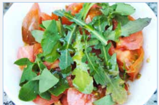
FIGURA 4. Ensalada o 'picadeta' de tomata amb fulles de cosconella ( Reichardia picroides ) i llicsó o lletsó ( Sonchus tenerrimus ).

Harvested leaves of Slender Sow-thistle, Sonchus tenerrimus , with several colours.