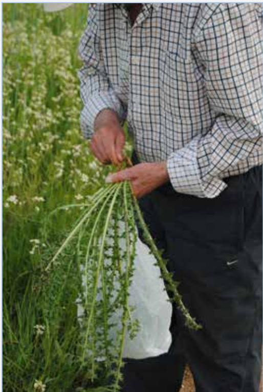
FIGURA 5. Recollida en el camp de cardets de moro, Scolymus hispanicus .

♦ Bunium sp. pl. (castanyoles, surollons, castañas de tierra , macucas ): plantes d'hàbits forestals que també es troben als marges dels cultius propers, representades per les espècies B. balearicum (Sennen) Mateo & López-Udías i B. macuca Boiss. S'usen els seus tubercles subterranis, moltes vegades situats a molta profunditat; es consumeixen crus, pelats i trossejats o preparats a talladetes, pel seu contingut en fècula, de sabor