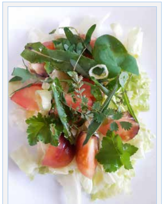
FIGURA 1. Ensalada campestre amb base de lletuga i tomata, amanida amb diverses espècies silvestres: Sonchus asper , Lavatera arborea , Sanguisorba minor , Allium ampeloprasum , Plantago lanceolata i Silene vulgaris .

'Les nostres plantes' (Climent, 1985) o el 'Costumari Botànic' (Pellicer, 2001-2004) ens permet trobar bona part d'aquesta ampla composició vegetal, que en molts casos pogué ser el resultat d'un procés multiseccular de selecció en què es van evitar les espècies tòxiques, però on se'n van incloure d'altres de sabors forts - picants, amargs, àcids - que contrastaven amb la resta de components del plat. En eixe procés selectiu també podria haver tingut rellevància el valor natracèutic de les seues espècies integrants, és a dir, les que funcionen com a aliments i que simultàniament posseeixen propietats curatives (v. Peris et al., 1995, 2001; Stübing & Peris, 1998; Rivera et al., 2005, 2006, 2008; Leonti, 2012; García-Herrera, 2014; Molina et al., 2014; Alarcón et al., 2015; Bernabeu-Mestre et al., 2015; Laguna et al., 2017). De fet, moltes de les espècies indicades en texts populars sobre fitoteràpia com ara els de Messegué (1973) o Juan (1883), són plantes silvestres comestibles que han estat emprades en les ensalades campestres,