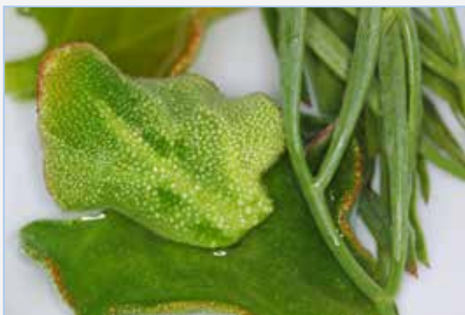
FIGURA 7. Fulles llavades de herba gelada ( Mesembryanthemum crystallinum ) i fenoll marí ( Crithmum maritimum ), preparades per a afegir-les a l'ensalada.

Encara que també sembla que s'hagen consumit en ensalada altres espècies del gènere Allium -particularment A. triquetrum L. (all de séquia, lágrimas de la Virgen ) i A. roseum L. (all de bruixa, ajo rosado )-, sembla que l'espècie silvestre que més s'arplega siga A. ampeloprasum L. (all porro, porradell, ajo porro ,