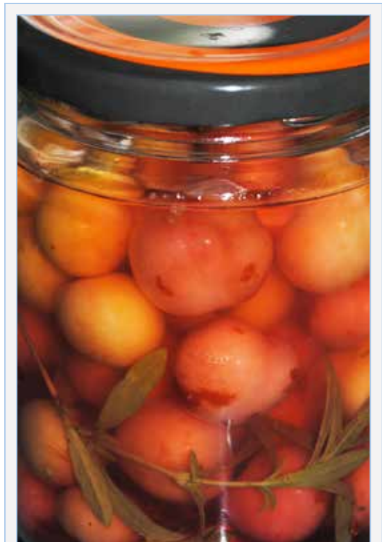
FIGURA 16. Cireres de cirerer bord ( Prunus avium ) adobades en aigua-sal, amb sajolida o herba d'olives ( Satureja intricata subsp. gracilis ).

* Família Vitaceae. Del raïm s'extrau el vinagre, component essencial - junt amb l'oli - de les ensalades. Però en aquest apartat volem referir-nos particularment a les formes silvestres i cultivades de les vinyes. Les puntes de les tiges verdes dels ceps de Vitis vinifera L. (vinya, vid ) sovint assilvestrada a les zones properes on es cultiva, és allò que es menja cru o assaonat en ensalada (Hoya de Buñol, Plana de Requena-Utiel). S'usen les tiges tendres de fins a mig centímetre de gruix, convenientment adobades en aigua-sal i més endavant pelades i fetes a trossets, que proporcionen al