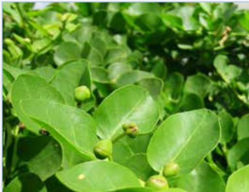
FIGURA 10. Tapenera ( Capparis spinosa ) amb els puncells florals, dels quals es fan les tàperes.

* Família Dioscoreaceae. Representada en la flora valenciana per Tamus communis L. (gatmaimó, nueza negra, truca ), espècie pròpia d'hàbitats forestals i preforestals de les comarques més plujoses de baixa altitud. Se'n consumeixen els brots de les noves tiges (esparraguets, esparraguillas ), cuits, amb un sabor amarg que recorda el dels brots del galzeran ( Ruscus sp.). La resta dels òrgans de la planta són verinosos pel seu contingut en saponòsids esteroïdals, derivats de la