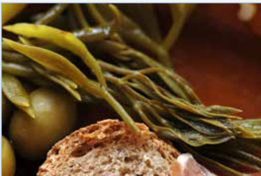
FIGURA 6. Fulles de fenoll marí ( Crithmum maritimum ) assaonades en aigua-sal, servides per a menjar.

♦ Scandix sp. (agulles de pastor, peine de Venus ): es tracta de plantes anuals prou freqüents en herbassars de pistes rurals i terrenys agrícoles, així com en pasturatges naturals. Tot i que l'espècie més citada per al consum és Scandix pecten-veneris L., és més que probable que s'hagen inclòs altres espècies valencianes que es diuen d'igual manera. El seu consum requereix cuinar-les prèviament, i usar els brots de la planta encara no fructificada.