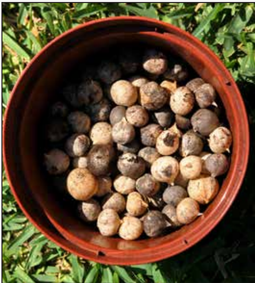
FIGURA 8. Collita de bulbs de l'all de sèquia ( Allium triquetrum ), abans de procedir a llavar-los, pelar-los i picar-los per afegir-los a les ensalades.

* Família Arecaceae (=Palmaceae). Corresponen a aquest grup les formes nadiues i assilvestrades de palmeres. Fins fa relativament poc de temps es consumia la medul·la del tronc de Chamaerops humilis L. (margalló, palmito ) -la part central més tendra de la medul·la- bé fóra crua o adobada en aigua-sal, i així es podia afegir a les ensalades. Aquest ús s'ha abandonat degut a la protecció de l'espècie, de la qual actualment només es permet la recol·lecció de palmes amb