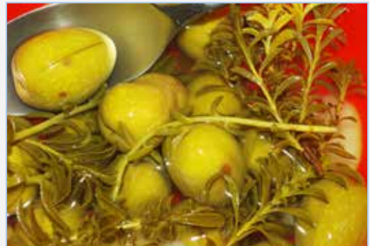
FIGURA 11. Olives ( Olea europaea ) i tiges de raïm de pastor ( Sedum sediforme ) en aigua-sal, adobades amb sajolida ( Satureja intricata subsp. gracilis ).

Caper plant ( Capparis spinosa ) with flower pumps, of which the capers are made.