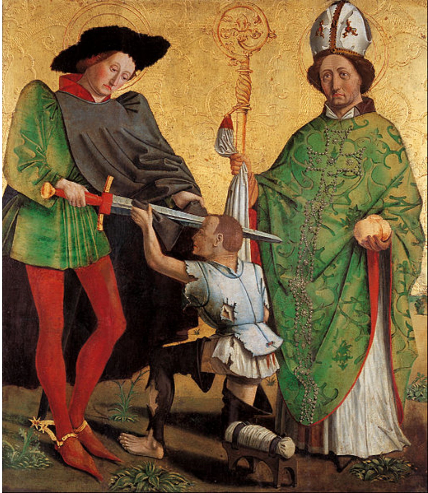
Fig. 9 (esta página) - Master of Uttenheim, São Martinho de Tours e São Nicolau de Bari , c. 1475. Art Gallery of Soud Australia.