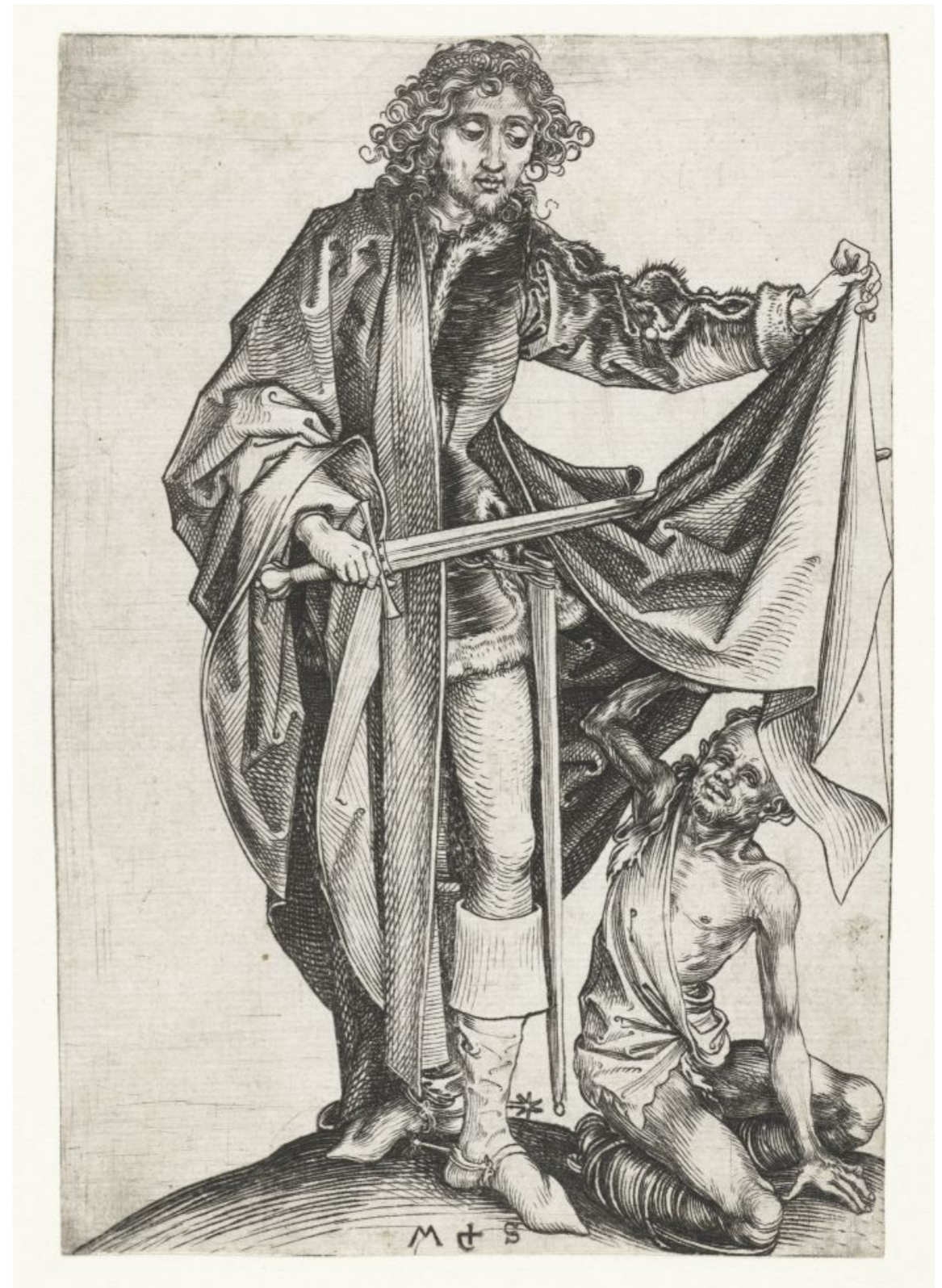
Fig. 8 - Martin Schongauer, St Martin , c. 1475-90, 15,4 x 10,4 cm, Rijksmuseum, Amesterdão.

É este o passo da vida de São Martinho que fez fortuna na iconografia cristã: a caridade de São Martinho em Amiens (ou São Martinho Misericordioso ). Grande parte das obras de arte que representam este momento fazem-no com Martinho a cavalo, voltado para trás, a cortar a capa que o mendigo recebe nas traseiras (ou ao lado) do animal, como se não tivesse acontecido um cruzamento entre os sujeitos, mas o recuo de São Martinho que alterou o seu trajecto para atender ao pedinte (figs. 1 a 7). Em menor número são as representações do Santo em pé, oferecendo a capa ao esmolo (figs. 8 a 10), bem como as que mostram Martinho a cavalo a cruzar-se frontalmente com o mendigo (figs. 11 a 13).