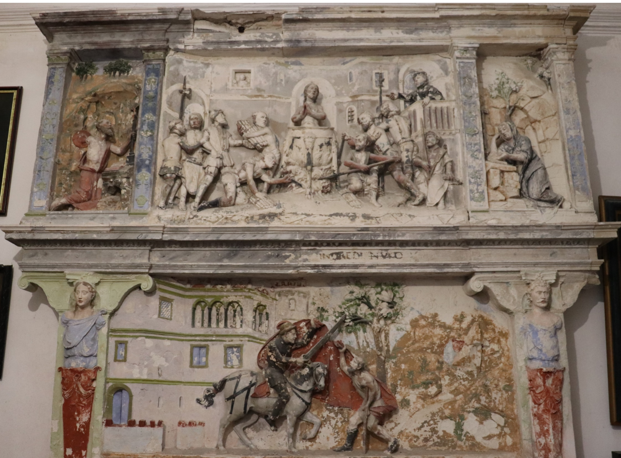
Fig. 13 - Retábulo de São João Evangelista e São Martinho, c. 1540, Sacristia da igreja do Mosteiro de Santa Maria de Celas, Coimbra.