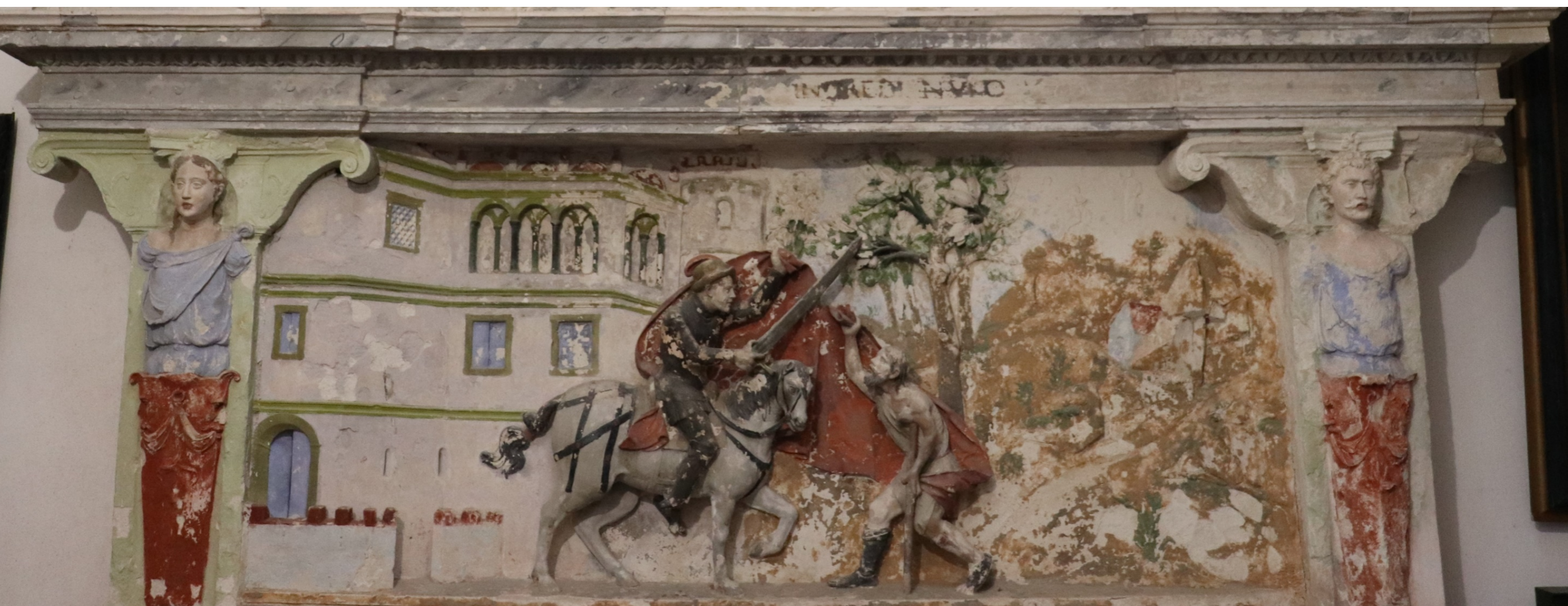
Fig. 14 - A Caridade de Martinho em Amiens , Sacristia da igreja do Mosteiro de Santa Maria de Celas, Coimbra.