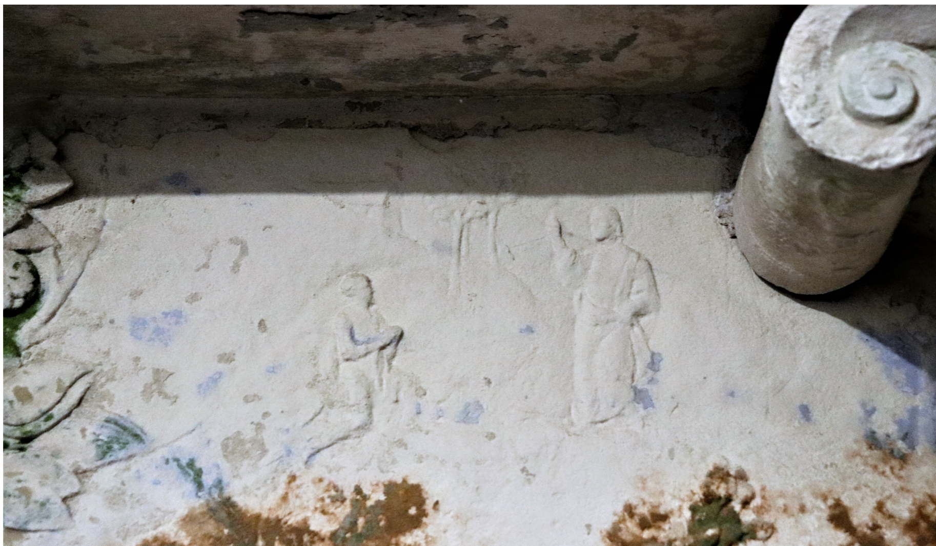
Fig. 16 - Pormenor.

O relevo da Caridade de São Martinho em Amiens representa o Santo a cavalo, virado para o mendigo, a cortar a clâmide que o pedinte agarra para com ela se agasalhar. Ao fundo e à direita apresenta-se uma fachada de um edifício de três andares ladeada por uma torre circular e, à esquerda, sobre a paisagem rochosa, pode ver-se, num relevo muito ténue, o sonho de São Martinho (fig. 16). Trata-se, por vários motivos, de um desenho curioso e relativamente invulgar para Portugal, na medida do cruzamento das personagens (que se afrontam) e porque o quadro encerra os dois momentos relacionais: a divisão da veste e o sonho com Jesus Cristo envergando a clâmide. Estes dois passos ali representados comunicam uma