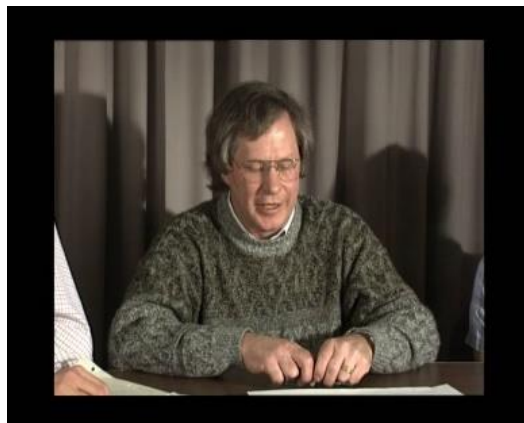
Gambar 2. Video konten head and shoulders