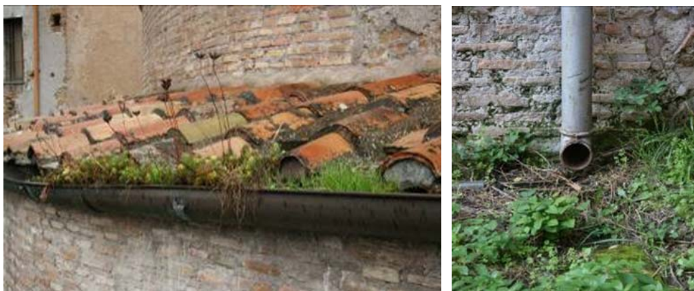
Figg. 6-7. Roma, Foro Romano, Tempio di Romolo. Inefficienza dei sistemi di allontanamento delle acque per intasamento dei canali di gronda e dispersione di acque al suolo non controllate.

Ciò dimostra ancora una volta che la conservazione dei beni culturali, anche dei beni archeologici, richiede attenzioni e “cure” per le quali, spesso, non necessariamente si deve fare ricorso a raffinate competenze di carattere archeologico, ma più semplicemente al buonsenso e alle conoscenze tecniche derivanti dalle regole dell’arte e dalle buone pratiche del costruire, ampiamente note e sperimentate. Senza sottovalutare, dunque, l’importanza delle competenze specialistiche, come condizione essenziale per consentire il riconoscimento di valore, e da qui derivare le opportune cautele nell’operare, si deve però considerare che le condizioni di degrado, il più delle volte causate da carenti o errate manutenzioni, non sono in genere dovute a limiti nelle conoscenze scientifiche o tecniche, ma a difetti e omissioni di tipo operativo, previsionale, organizzativo e pianificatorio.