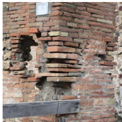
Fig. 5. Pompei. Carenti manutenzioni mettono in pericolo la stabilità delle murature.