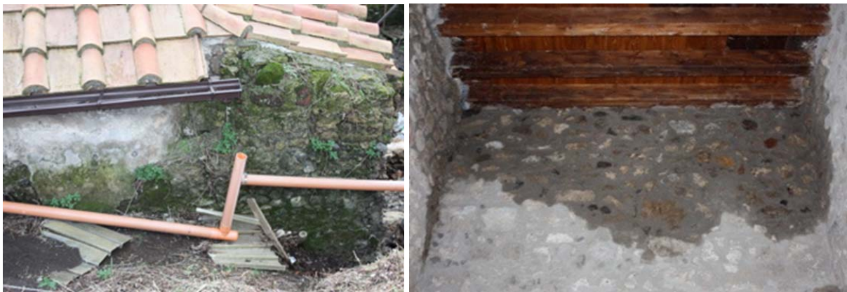
Figg. 2-3. Pompei, Casa di Trebio Valente. Infiltrazioni di acqua da coperture recenti con carenti impermeabilizzazioni e inefficienze nei sistemi di allontanamento delle acque piovane.

Si veda per esempio il caso di Pompei. Le attività ispettive eseguite a campione su alcune domus (casa della Fontana Piccola, Casa di Trebio Valente, Casa del Moralista, via Stabiana) richieste dal Segretariato Generale MiBAC a seguito del crollo della Schola armaturarum nell'autunno 2010 24 , hanno messo bene in evidenza errori di carattere tecnologico e costruttivo, a volte del tutto banali, e quindi facilmente evitabili, compiuti sulle strutture più recenti (murature di completamento, solai, coperture e strati di impermeabilizzazione, sistemi di convogliamento e regimazione delle acque piovane). Di conseguenza i danni derivanti, p. es., dalle copiose infiltrazioni di acqua (Figg. 2-7), hanno coinvolto anche le murature archeologiche con inumidimenti, efflorescenze, patine biologiche, ecc., che hanno causato degradi su murature antiche, intonaci, dipinti.