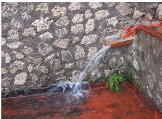
Fig. 4. Pompei, Casa della Fontana Piccola. Inefficienze nei sistemi di allontanamento delle acque piovane.