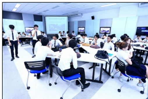
รูปที่ 2 ศูนย์การเรียนรู้ i-SCALE คณะวิศวกรรมศาสตร์

คณะวิศวกรรมศาสตร์ จุฬาลงกรณ์มหาวิทยาลัย [4] ได้เปิดตัวนวัตกรรมการเรียนการสอนรูปแบบใหม่ ที่เรียกว่า “การศึกษาระบบ 4.0 หรือ Chula Engineering Education 4.0” อย่างเป็นทางการ จนทำให้เกิดการปฏิวัติการเรียนการสอนในรูปแบบใหม่