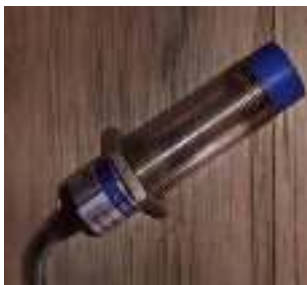
Gambar 1. sensor Proximity LJC 18 A3-B-Z/Bx (Nurrohman, 2019)

Berdasarkan permasalahan diatas maka timbulah ide untuk membuat prototype alat cuci mobil otomatis dan membutuhkan sensor yang dapat digunakan sebagai penanda mobil, sehingga diperlukan analisis penggunaan sensor agar prototype alat cuci mobil otomatis dapat digunakan dengan baik. Sensor yang akan dianalisis adalah sensor Proximity LJC 18 A3-B-Z/Bx seperti pada gambar 1.