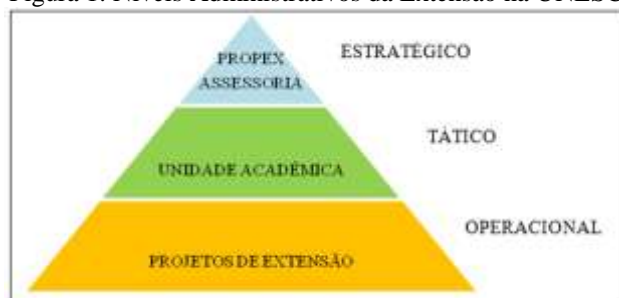
Figura 1: Níveis Administrativos da Extensão na UNESC.

As entrevistas (E01; E02 e E03), revelaram que as atividades de extensão da UNESC estão relacionadas diretamente a três níveis administrativos. Em uma construção hierárquica são representados consecutivamente pela PROPEX, pelas Unidades Acadêmicas e Projetos Comunitários. Conforme Antony (1965), os níveis para tomada de decisão dentro de uma organização podem ser divididos em estratégico, tático, operacional. No nível estratégico são definidas as políticas da empresa, no nível tático ocorre o controle, neste ponto é verificado se o planejamento estratégico da empresa está seguindo conforme pretendido. O nível operacional é onde são desenvolvidas as atividades. Assim a Figura 1 apresenta os setores dentro da UNESC, que se referem a cada nível mencionado.