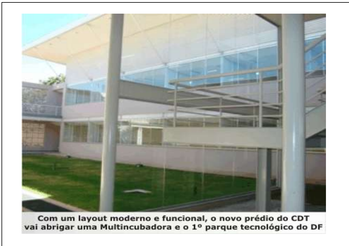
Figura 4 –1ª Fase da Construção do Parque Científico e Tecnológico no CDT/UnB

No caso de parcerias advindas no CDT/UnB para a construção da expansão do Parque Científico Tecnológico, foi por meio de recursos financeiros governamentais, como FINEP, Ministérios entre outros.