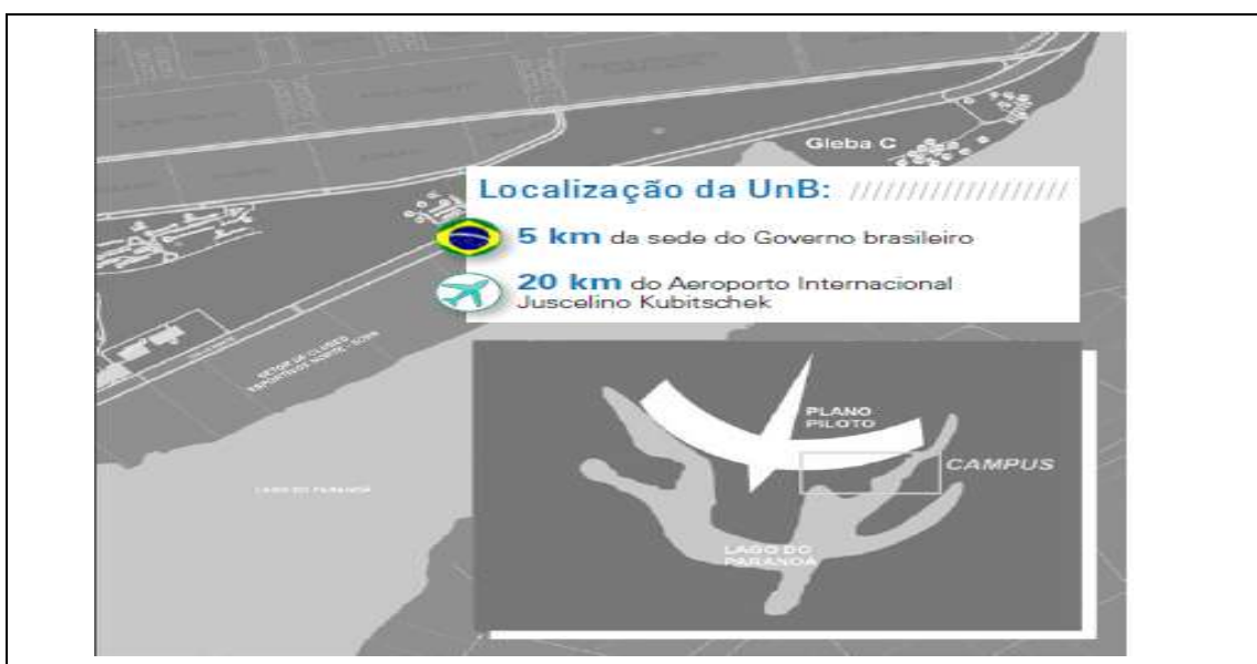
Figura 2 - Localização UnB 02