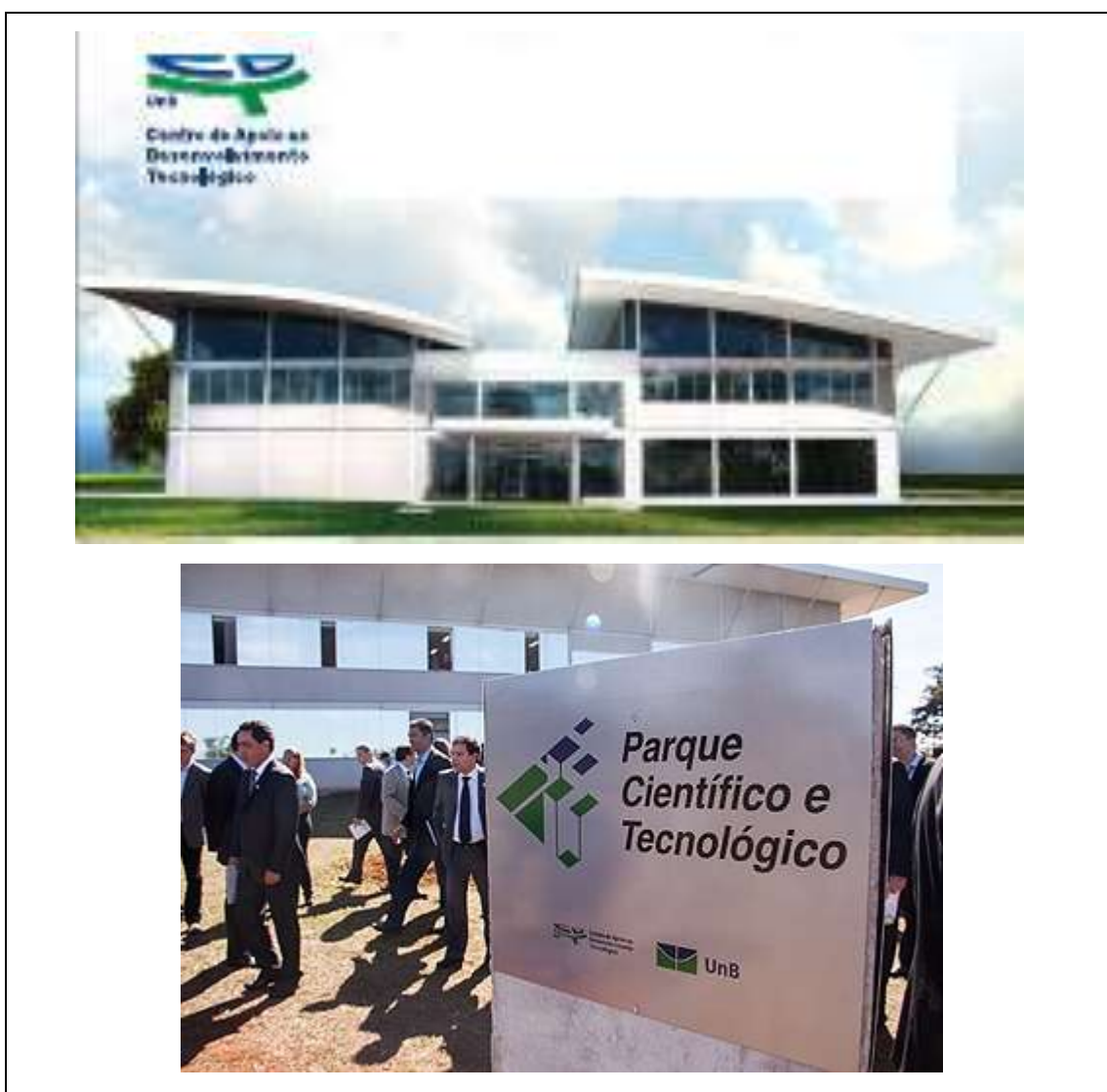
Figura 3 - Lançamento do Parque Científico Tecnológico no CDT/UnB