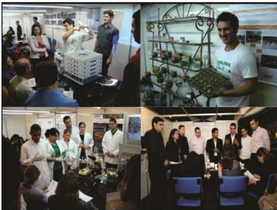
Figura 1: Apresentações dos TIGs no Circuito Acadêmico