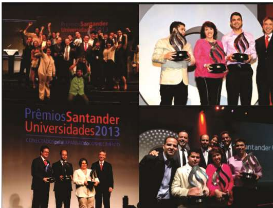
Figura 3: Alunos premiados no Prêmio Santander Universidades em 2013 e 2014

h) Periodicidade que estimula a produção e integração: a realização semestral do TIG nos cursos gera nos alunos uma percepção de desenvolvimento mais expressivo. Os relatos sobre essa percepção são frequentemente vinculados à realização do Circuito Acadêmico ao final de todo o semestre, conforme argumenta a reitora do UniBH: "o Circuito traz uma sensação de desfecho aos alunos uma vez que a cada semestre eles percebem que seus esforços geram frutos e que há propósito por trás dos objetivos do TIG". Essa afirmação é corroborada pela diretora do Núcleo Acadêmico que afirma que "o ambiente de 'linha de chegada' do Circuito Acadêmico estimula os alunos nos semestres posteriores a apresentarem resultados ainda melhores e sustenta sua motivação durante os desgastes naturais no decorrer de um semestre de estudos e atividades".