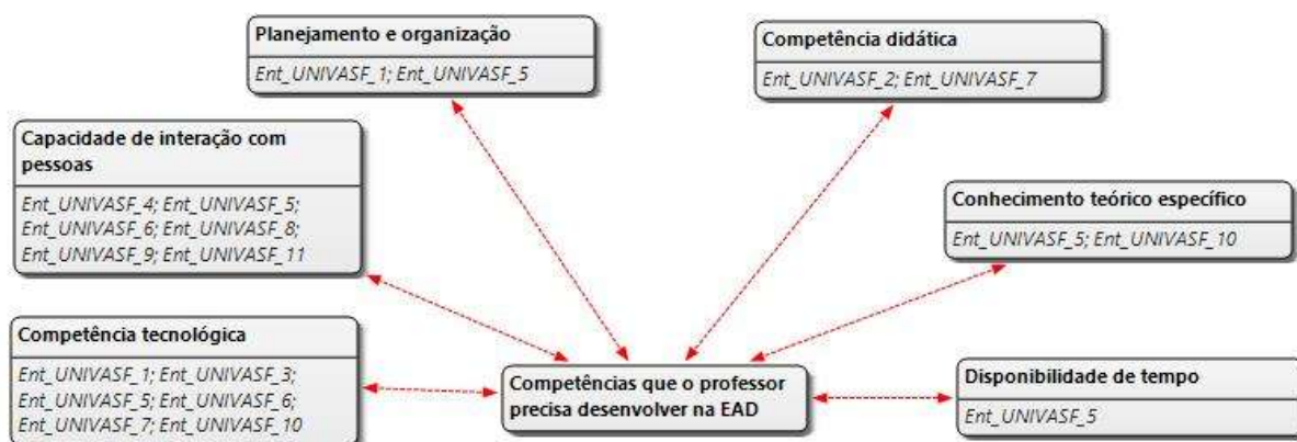
Figura 5 – Teia das competências docentes para EAD

O resultado pode ser visualizado por meio de uma teia na Figura 5.