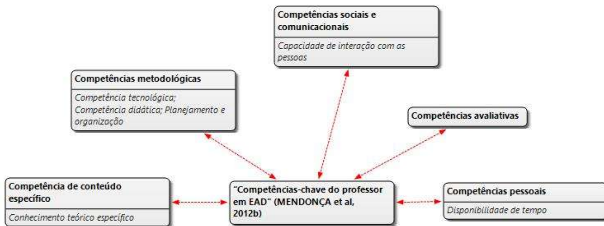
Figura 6 – Teia das competências-chave do professor em EAD UNIVASF

Ao comparar as competências elencadas pelos professores com o conjunto de competências estabelecido na ação competente do professor no modelo integrado para o desenvolvimento das competências dos professores e discentes a partir das dimensões para a implementação da EAD em contextos universitários, apresentado na Figura 3, percebe-se que os professores destacam a importância para as competências metodológicas, de conteúdo específico, pessoais e sociais e comunicacionais, conforme a teia representada na Figura 6. Os professores parecem não considerar, embora sejam tão importantes quanto as outras, as competências avaliativas para o desempenho na EAD. Desse modo, é preciso considerar que as competências eletrônicas necessárias para a atuação na EAD não são relativas apenas aos aspectos técnicos, ou seja, elas precisam desenvolver uma visão mais ampliada sobre a capacidade educativa para a utilização das TIC no ensino e aprendizagem (STALMEIER, 2006; SCHNECKENBERG, 2010b; VOLK; KELLER, 2010; GILBERTO, 2013).